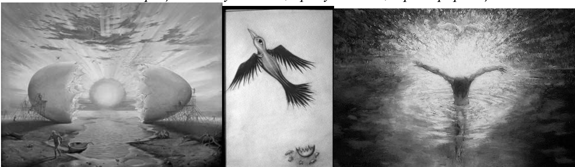
Рис.5. IV матриця. Вихід назовні, з'єднання з Всесвітом. Страх втратити це