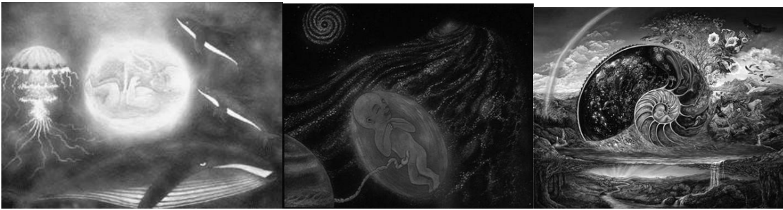
Рис.1. I перинатальна матриця (позитивна утроба). Океанічні, космічні відчуття, відчуття єдності з Всесвітом.