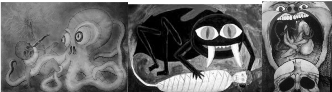
Рис. 3. II перинатальна матриця. Образи обвивання восьминогом, павуком, попадання в пастку, відчуття проковтування, неможливість впоратися з ситуацією.