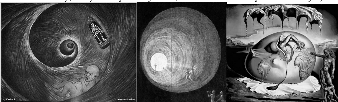
Рис. 4. III перинатальна матриця. Образ вихору, що затягує, коридору зі світлом в кінці, процес виходу назовні, пробудження, трансформації.