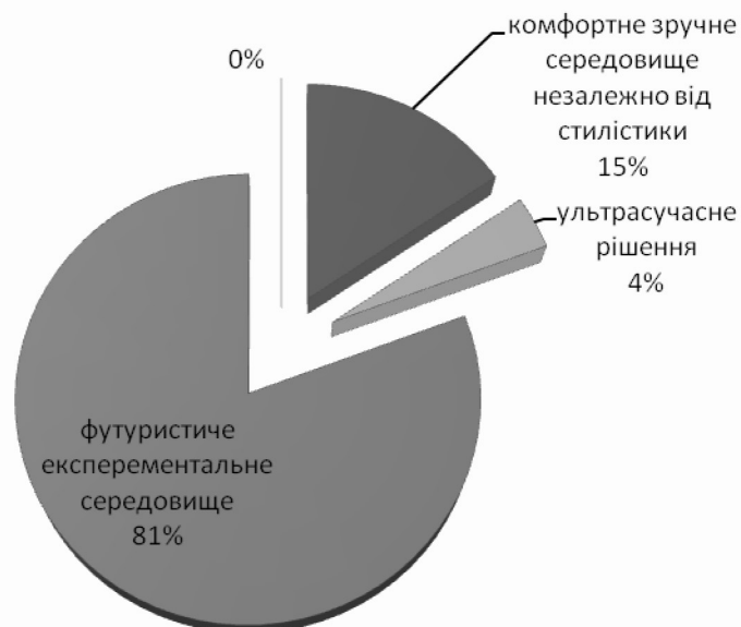
Рис. 2. Вибір архітектурно-просторового рішення студентського житла

Представлена на рис. 2 діаграма показує, що в переважній більшості студенти технічних і гуманітарних спеціальностей бажають відпочивати в своїй оселі зі зручною функціональною організацією. Студенти архітектурно-художніх спеціальностей, будучи за своєю натурою і професійним спрямуванням експериментаторами і творчими першовідкривачами нових функціонально-просторових утворень в житловому середовищі, ставлять на перше місце незвичайність і екстравагантність студентського житла, нестандартний дизайн інтер'єру житлового осередку, що відображає внутрішній світ особистості студента. І тільки 4% опитуваних студентів: дизайнери віртуального світу, біохакери, інженери по відновленню природного середовища віддали перевагу ультрасучасним архітектурно-планувальним рішенням.