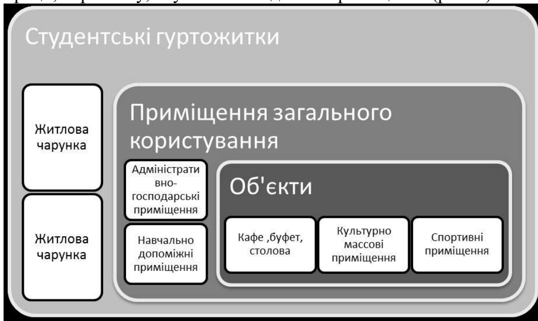
Рис.3. Блок-схема основних приміщень студентського гуртожитку

У процесі дослідження визначено загальні функціонально-планувальні елементи студентського гуртожитку. Житло студентів складається з наступних основних функціональних зон: житлова зона, що включає житлові кімнати з підсобними приміщеннями та поверхові обслуговуючі приміщення; громадська зона (група приміщень громадського харчування, культурно-побутового обслуговування, спортивних занять); адміністративно-господарська (кімнати адміністрації, персоналу, службові та підсобні приміщення (рис. 3).