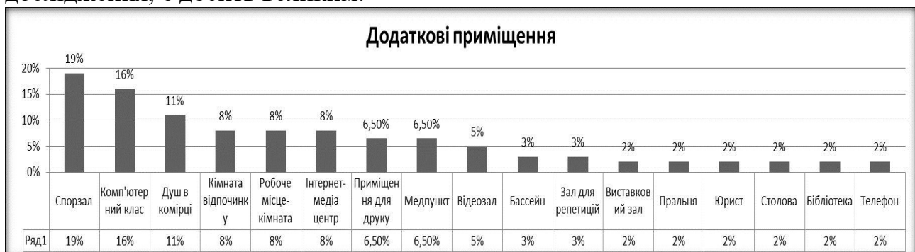
Рис.4. Діаграма додаткових приміщень у студентських гуртожитках

Існуючі будинки та комплекси студентського житла характеризуються, в цілому, недостатньо розвиненою інфраструктурою побутового і культурного обслуговування. Наступна діаграма, представлена на рис.4, відображує додаткові бажані послуги та відповідні приміщення, перелік яких, як показало дослідження, є досить великим.