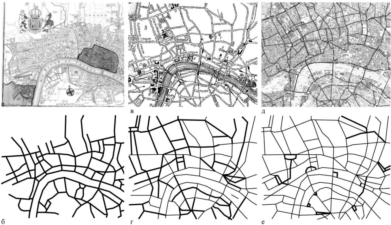
Рис. 2. Розпланування історичного центру м. Лондон, Великобританія: а – карта 1750 р., автор – мр. Соттер; б – схема карти 1750 р.; в – схематичний план центральних районів Лондону на початку ХХ ст., автор – Іконніков А.В.; г – схема плану центральних районів на початку ХХ ст. з новими елементами; д – фрагмент плану 2016 р.; е – схема фрагменту плану 2016 р. з новими елементами

Тож аналіз теоретичних напрацювань та графо-аналітичне дослідження розвитку обраних для аналізу історичних міст України та Європи, серед яких найбільш яскраво виділяється Харків та Лондон, дає змогу виділити тенденцію взаємопроникнення як найбільш розповсюджену та характерну, оскільки для різноманітних періодів міського розвитку притаманне утворення нових, актуальних на момент впровадження, розпланувальних композицій, що в подальшому, через розширення зон їх впливу, приєднуються одна до одної та створюють єдиний цілісний комплекс з різнохарактерних елементів і форм міського середовища. Графо-аналітичний аналіз засвідчив неможливість існування одного єдино вірного напрямку розвитку просторово-часової композиції історичних міст. На різноманітних етапах певні елементи середовища, очевидно, спроможні взаємодіяти за різними принципами, а окремі розпланувальні системи в один історичний період можуть поєднуватись на основі різних закономірностей. Аналіз розпланувальних систем 10 міст, підтвердив той факт, що виділення певних тенденцій є відносно умовним. Разом з тим слід брати до уваги узагальнені характеристики процесів розвитку просторово-часової композиції міського середовища, елементів