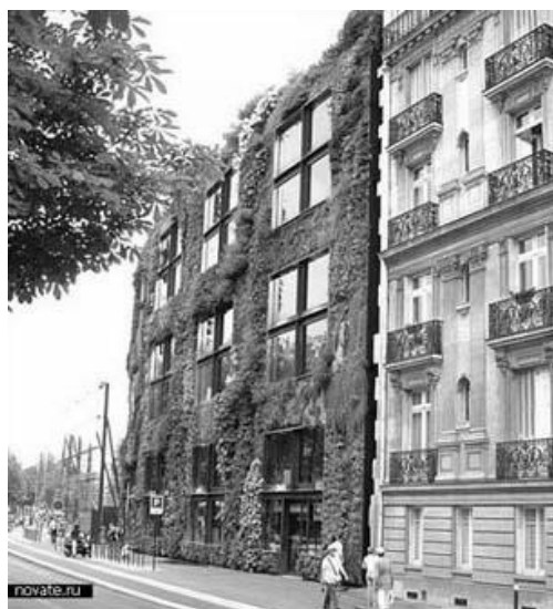
Рис. 3. Будинок-сад в Мадриді

3. Вертикальне озеленення може виконуватися на всіх фасадах, на його частині або на окремо розташованих вертикальних елементах та в інтер'єрі. Такий прийом знизить перегрів стін, приховає недоліки забудови або, навпаки, підкреслить її окремі елементи. Фасадне озеленення створює ілюзію зеленого оточення, що дозволяє подолати монотонність міської забудови. Вертикальним озелененням можна вважати і такий прийом, як квітники на балконах. Приклад вертикального озеленення – будинок-сад в Мадриді, П. Бланк (рис. 3).