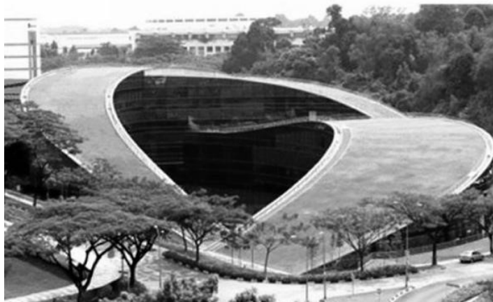
Рис. 1. Школа мистецтв, дизайну і засобів масової інформації в Сінгапурі.

Прикладами застосування такого типу озеленення будівель може служити – школа мистецтв, дизайну і засобів масової інформації в Сінгапурі (рис. 1).