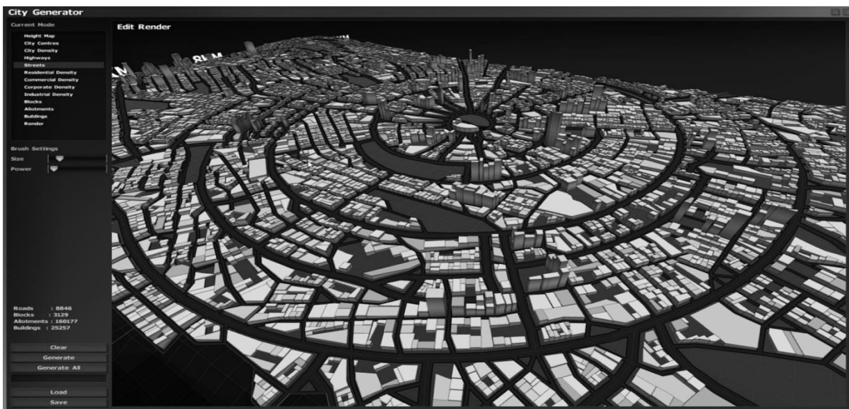
Рис.2. Місто, сгенероване комп'ютером на базі однієї з платформ City Generator .

Якщо замість окремого об'єкту розглядати урбаністичний вузол, з'являється можливість досліджувати приховані зв'язки між різними елементами системи, моделювати потовми та напрямки руху людей, транспорту, їх взаємодію і вплив на міську інфраструктуру. Гіпотетично доцільно об'єднати цю технологію з генератором міста, що може працювати навіть з чорно-білою зйомкою генплану. Параметричні дані даного міста чи кварталу вводяться додатково. Платформа генерує геометрію будівель, дороги, рельєф місцевості (Рис.2). Цікаво не тільки моделювати існуючі місцеві ситуації для вирішення сучасних планувальних задач, але й генерувати розвиток міста. Для цього необхідно задавати спеціальні алгоритми розвитку, згідно контексту.