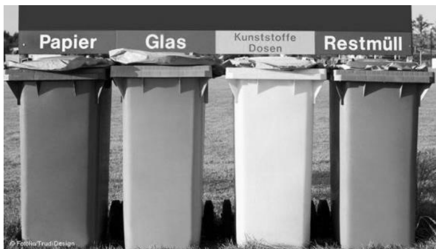
Мал. 2. Сортування сміття - табличка в одній з німецьких університетів.

- Екологічне управління відходами: наприклад, безтермічна переробка сміття, при якій не застосовуються високі температури (приватний вид - компостування харчових залишків). Включає вторинну переробку відходів, виробництво біопалива та стимулювання застосування в щоденній практиці методу сортування сміття (мал. 2), в тому числі пропаганда і просвітництво починаючи з до- і шкільних освітніх установ;