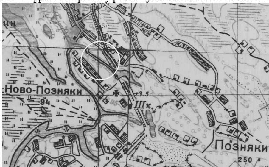
Рис. 3. Фрагмент топографічної карти масштабу 1:25 000 (Генеральний штаб РСЧА, 1933–1937 рр.). Озеро Качине виділено колом.

Значний обсяг картографічних робіт виконано і в 30-х роках ХХ ст. Їх результатом стала серія топографічних військових карт Генштабу Червоної Армії. Детальний фрагмент району розташування Позняків показано на рис. 3.