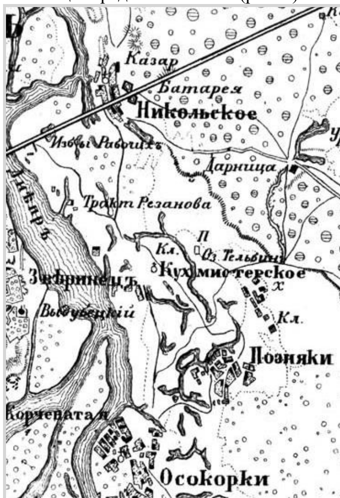
Рис. 1. Фрагмент плану околиць Києва, 1850 р.

Висвітлення основних результатів. Особливістю рельєфу Києва є наявність долини Дніпра, ширина якої сягає 10 км і навіть більше. Правий її схил крутий, лівий – пологий. У межах річкової долини сформувалася доволі широка заплава – насамперед уздовж лівого берега. Раніше вона часто затоплювалася – інколи на кілька метрів. Це, зокрема, сталося під час історичної повені навесні 1931 р. Тож не випадково на заплаві існували і продовжують існувати численні озера. Про це свідчать численні картографічні твори, зокрема, датовані ще серединою XIX ст. (рис. 1).