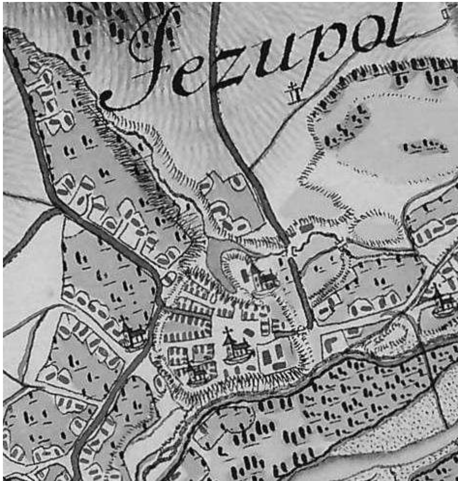
Рис. 2. Єзупіль. Історична карта періоду імперії Габсбургів (1763 - 1787 рр..) Фрагмент [12].

матеріали, головною з яких є кадастрова карта 1847 року (Рис. 3), із сучасною топогеодезичною підосновою міста.