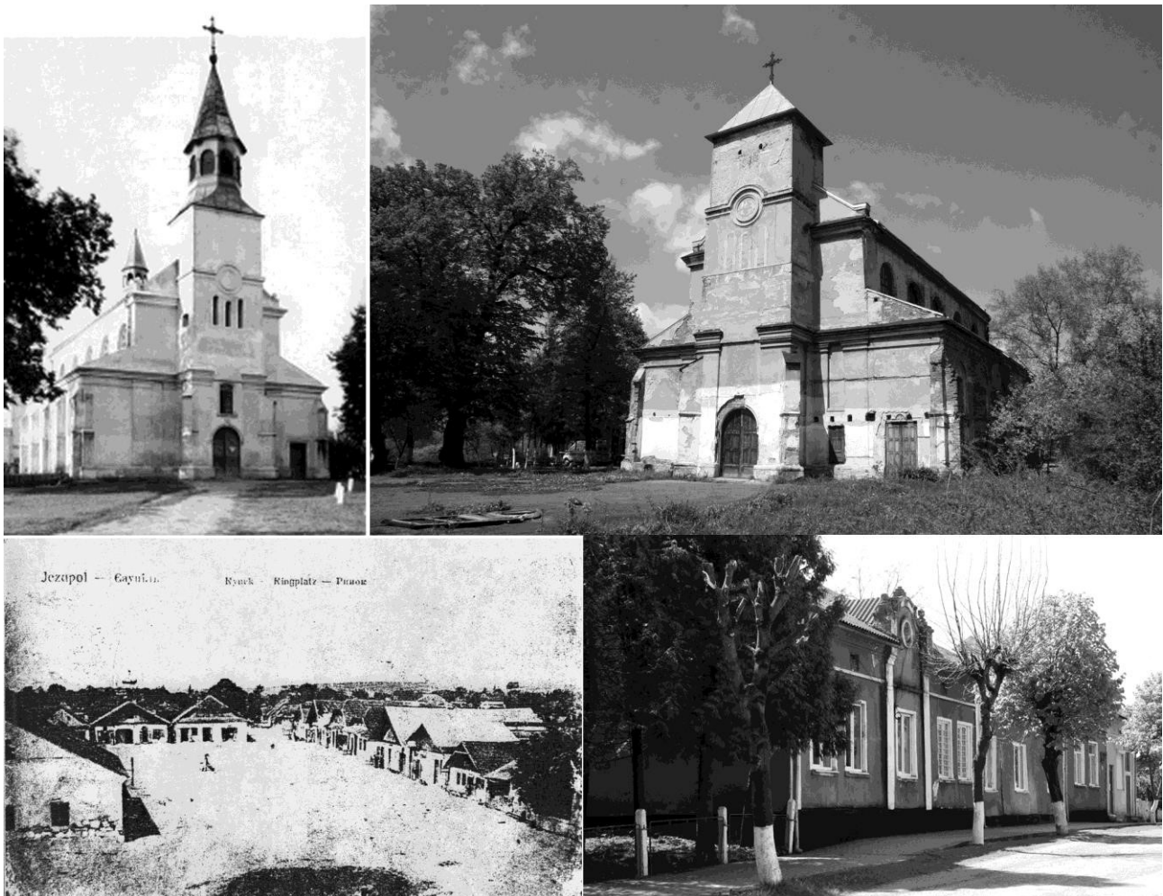
Рис. 1. Історичні та сучасні зображення міста Єзуполя: Домініканський костел (сер. XVII ст.); забудова ринкової площі.

Єзупіль є прикладом реалізації прогресивних європейських містобудівних теорій XVII – XVIII ст. Розглянутий містобудівний об'єкт відповідає урбаністичній моделі міста-резиденції, суть якої полягає у принципі розташування середмістя поєданого із замком. Така модель з'явилась на території колишньої Речі Посполитої в другій половині XVI ст. і застосовувалась у різних варіантах просторових вирішень. Нова оригінальна і незвичайна концепція форми, ролі і функції, яку часто зустрічаємо у цей період залишила по собі багатство накопичених культурних цінностей у наступних століттях.