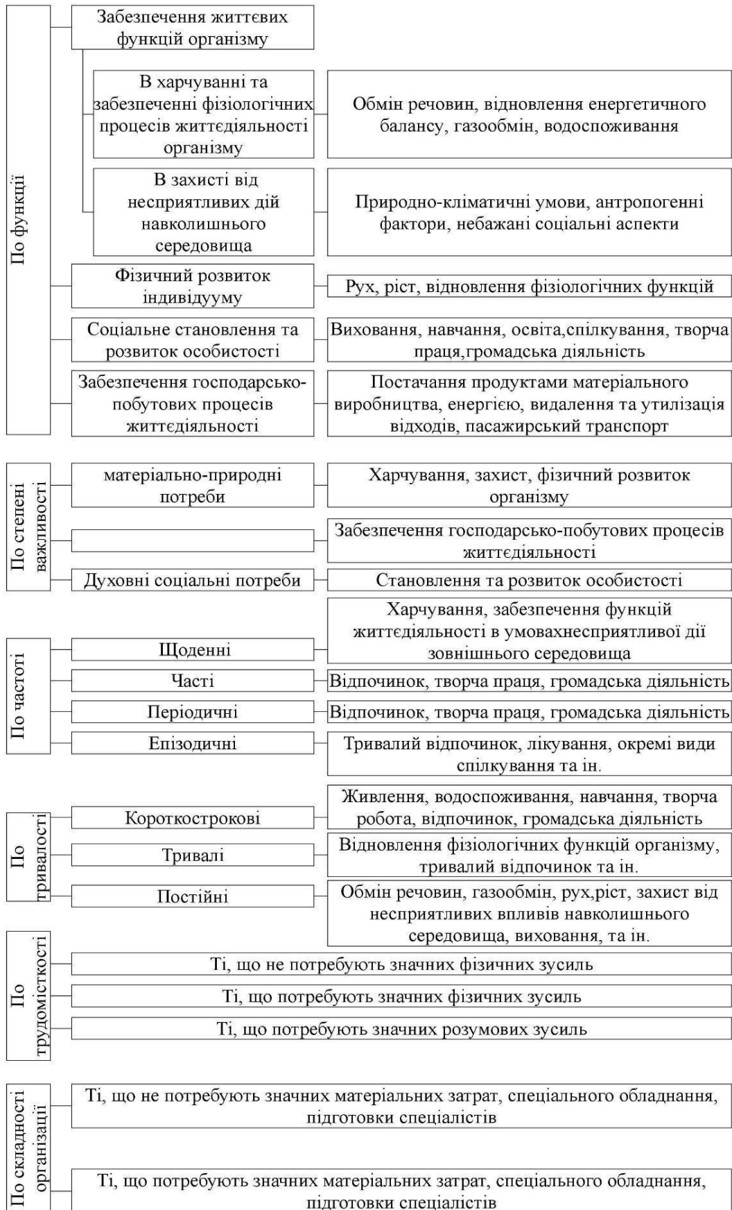
Рис.1 Містобудівна класифікація потреб населення (за М.М.Дьомінім)