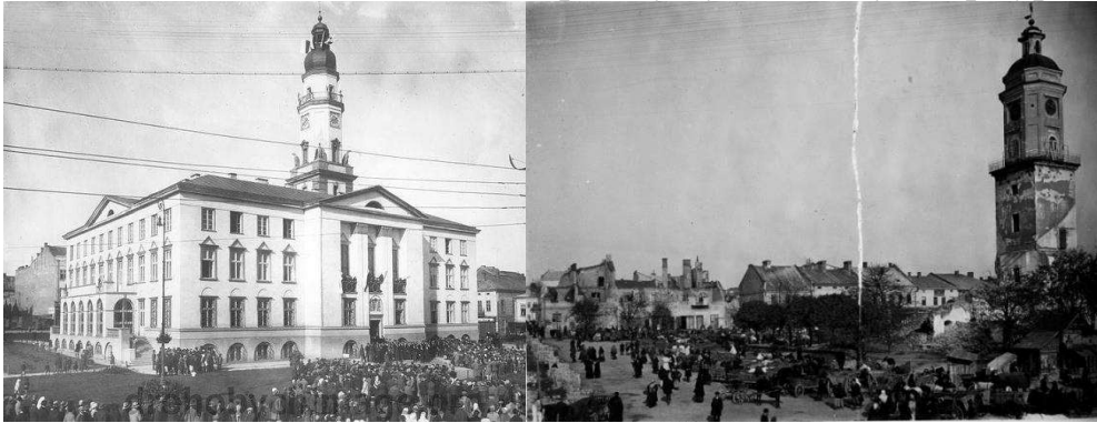
Рис.4 Ратуша у м. Дрогобич. Фото 1956 року та зображення на старих польських фото.

Нікодимемовича. В середині ратуші є внутрішній дворик, який оточують стіни ратуші. Спеціально для засідань міської ради у будівлі існує мармурова зала.