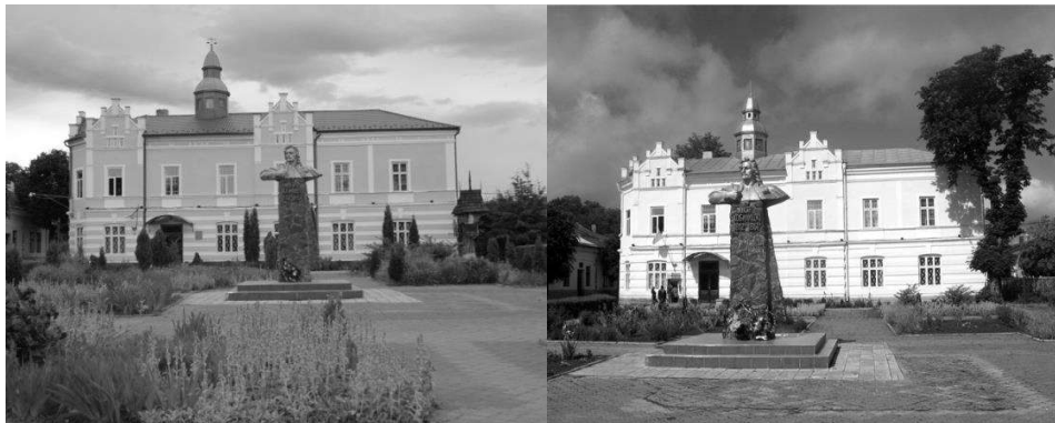
Рис. 5 Ратуша у Вижниці - сучасний вигляд

України - держказначейство, а у наші дні - міський суд. Більшість часу ратуша слугувала будівлею виконавчого апарату міста, і лише за незалежної України змінила призначення.