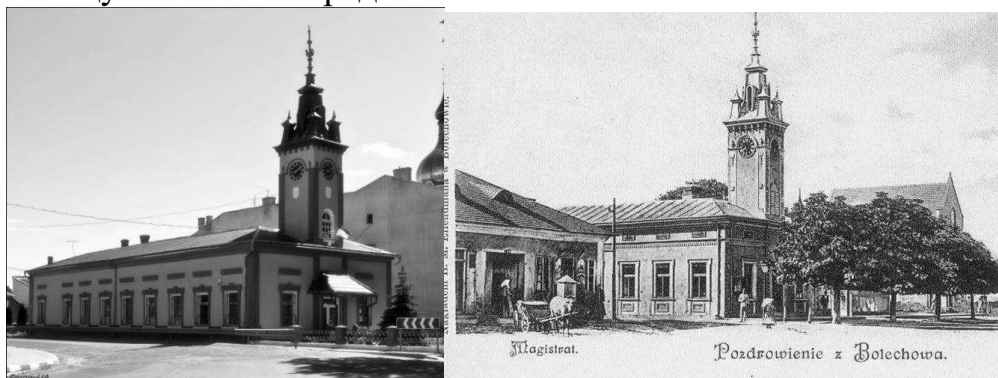
Рис. 3 Ратуша в Болехові - сучасний вигляд та зображення на старих польських листівках.

Болехів. Івано-Франківська область. Населення: 21610 осіб. Міська ратуша споруджена у 1863 році. Ратуша має лише один поверх, у плані прямокутної форми. Головне призначення ратуші не змінюється з роками, тому до сих пір у будівлі розміщується міська рада Болехова.