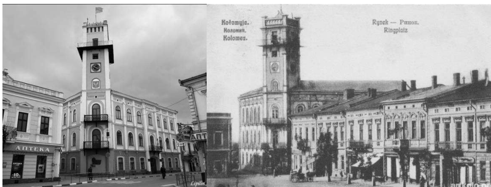
Рис. 2 Ратуша в Коломиї - сучасний вигляд та зображення на старих польських листівках.

Отже, основними функціями за період існування міської ратуші м. Коломия були: управлінська, адміністративна, освітня та, навіть, частково слугувала поліклінікою.