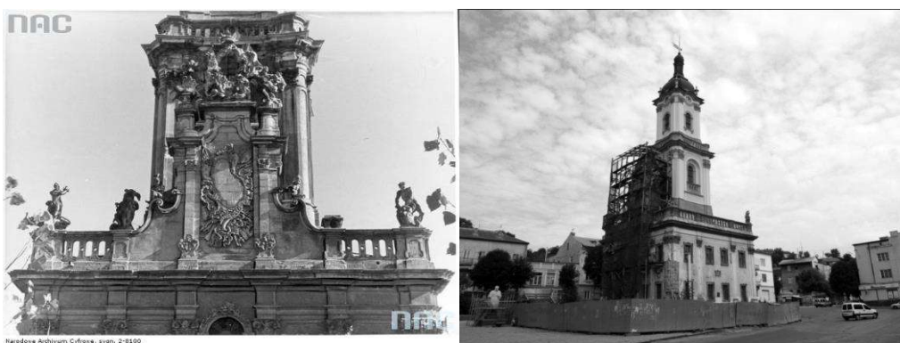
Рис. 1 Ратуша м. Бучач перед II Світовою Війною та сучасний вигляд

архітектора Бернарда Меретина та скульптора Іоганна Георга Пінзеля. Два нижніх яруси мають дванадцять залів, де була розміщена адміністративно-управлінська ланка міста та торговельні приміщення, які надавались в оренду місцевим торговцям. У 1811 році сталася пожежа, що змінила зовнішній вигляд ратуші. Згодом, у 20-х роках ХХ ст. перший поверх ратуші займали торгові приміщення, а другий - житло. Внаслідок такого використання до середини 50-х рр. було втрачено майже третину кам'яно-фігурних прикрас. У 1982 році у будівлі Бучацької ратуші було створено краєзнавчий музей та художню галерею. Наразі ратуша м. Бучач знаходиться на реставрації, відновлюються всі втрачені елементи скульптурного оздоблення. Щодо основних функцій, які надбала міська ратуша, то можна виділити: управлінську - магістрат, адміністративну, житлову, освітню (худ. школа), культурну (музей).