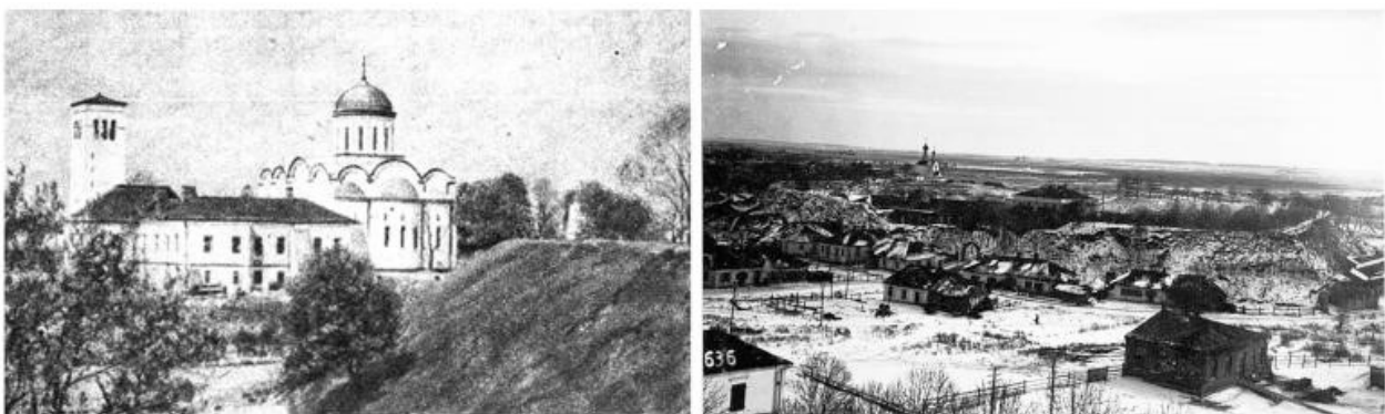
Рис. 2. Земляні вали. Фото приблизно 1920-ті роки

Як приклад вирішення проблеми реставрації - пам'ятка арх. IX-XVI ст. земляні вали замку у місті Володимир-Волинському (рис. 2).