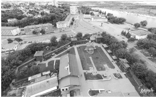
Рис. 1. Городище на «Замковій горі» в місті Мозирі

Закордонним аналогом може слугувати реставрація міста Мозиря, (Республіка Білорусь), що охоплює найбільш важливу частину історичного центру. Головною особливістю історичного центру Мозиря є збережена планувальна структура XII ст. з унікальним ландшафтом, який підкреслює пагорб "Городища стародавнього Мозиря" (рис. 1).