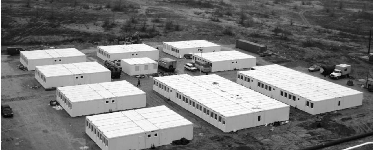
Рис. 3. Транзитне містечко для внутрішньо переміщених осіб у Запоріжжі за німецьким проектом

дивлячись на досить низьку плату за проживання для самих переселенців, для бюджету міст це значне навантаження. До того ж таке обособлене розміщення не сприяє соціальній інтеграції переселенців до структури локальних міських громад (рис.3).