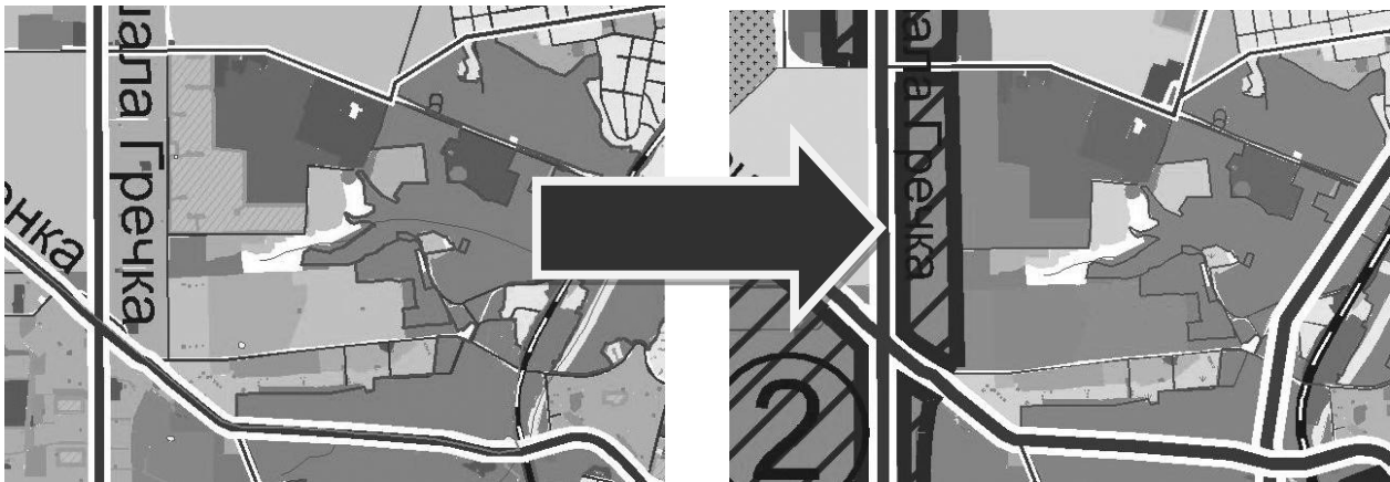
Рис. 2. Фрагмент генерального плану використання території Києва згідно стратегічної ініціативи «Київ 2025»

плани сучасного розвитку і використання таких міст, як Київ, Харків, Дніпропетровськ, Запоріжжя, які, в свою чергу є найбільшими центрами із найбільшою концентрацією переселенців, можна виявити тенденції до зміни функції промислових, сільськогосподарських і науково-дослідних зон на житлову або рекреаційну. Прикладом може бути генплан (рис. 2), що ілюструє зміну функціонального призначення закинутих територій дендропарку «Сирець» і прилеглої забудови, відповідно до нового, житлового призначення.