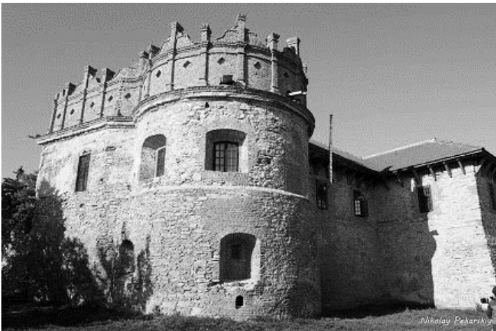
Рис. 3. Наріжна вежа Замку Острозьких (сучасний вигляд)

Михайловський Є.В. називає п'ять таких методів: консервація (передбачає запобігання подальшому руйнуванню та укріплення пам'ятки без зміни її загального фізичного об'єму), фрагментарна реставрація (часткове