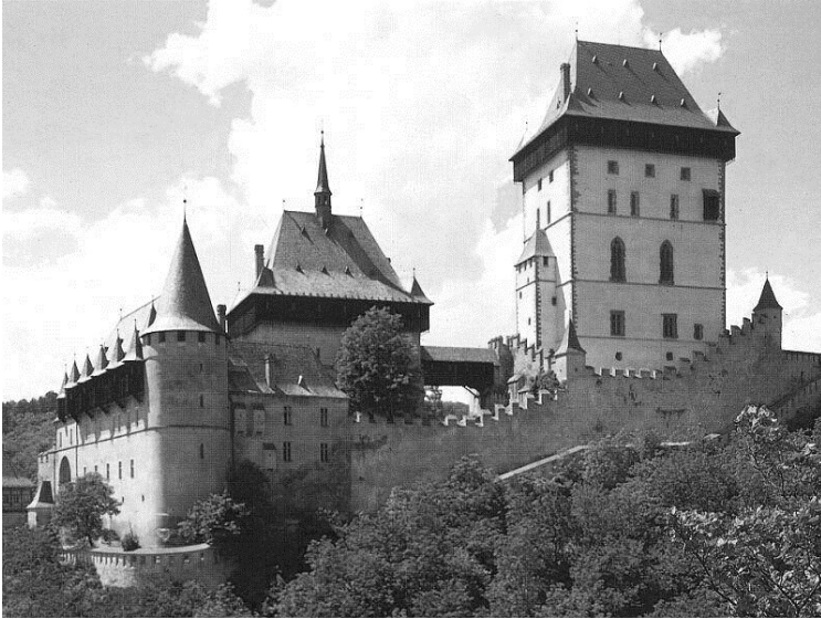
Рис. 1. Замок Карлштейн. Реставрація