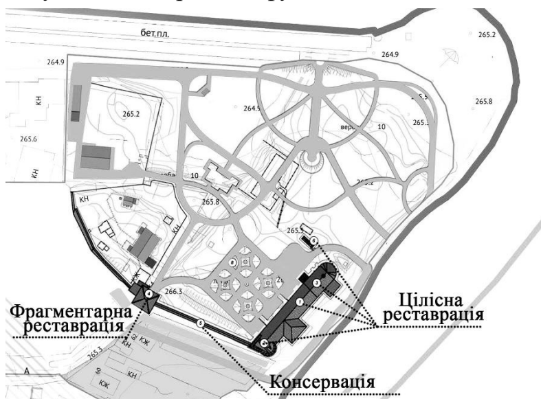
Рис. 5. Пропозиція щодо реставрації Замку Острозьких

Мурований замок також двоповерховий, має великий підвал. В замку помітне характерне для середньовіччя поєднання у житлових приміщеннях побутових і оборонних функцій.