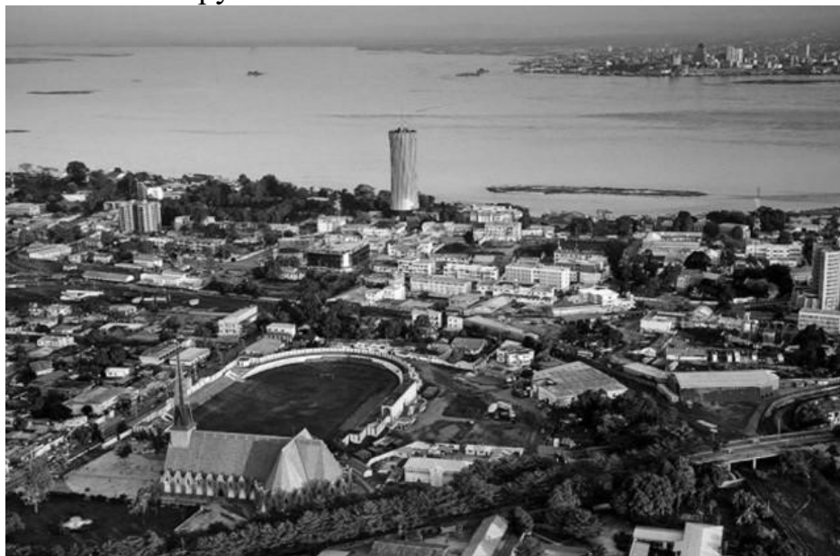
Рис. 1 Столиця Республіки Конго Браззавіль

висоті 230 метрів над рівнем моря. Народи Конго мають багаті культурні традиції - музичні, танцювальні та художні. Повсюдно збереглися такі ремесла, як різьблення по дереву, коски, плетіння кошиків. Особливий інтерес представляють дерев'яна скульптура і маски з відмітними особливостями кожної етнічної групи.