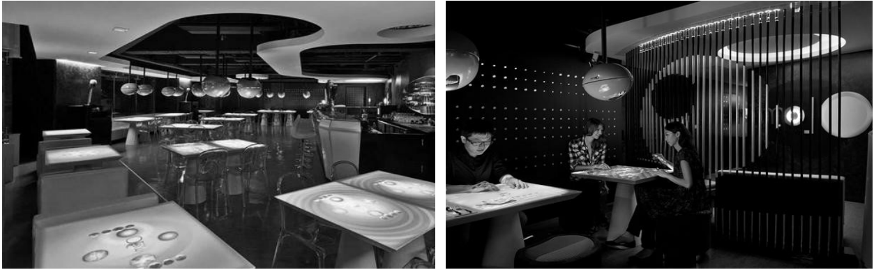
Рис. 3. Ресторан з інтерактивними поверхнями столів.