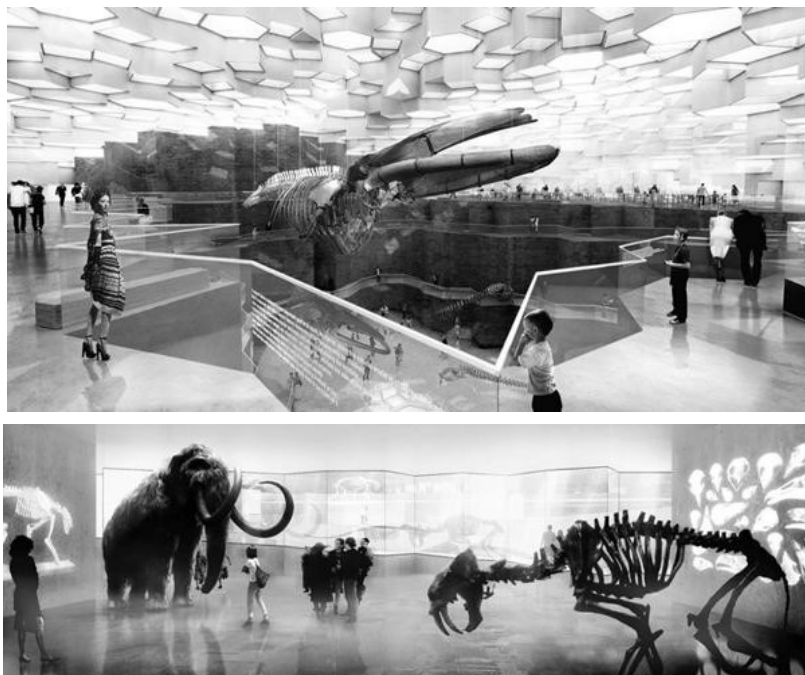
Рис. 5 . Проект інтер'єрів природознавчого музею в Копенгагені. Данія.