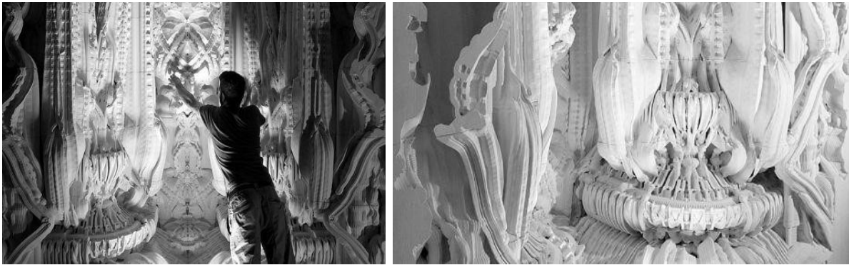
Рис.4 . Інтер'єр у стилі Бароко з використанням новітніх технологій 3-Ддруку.