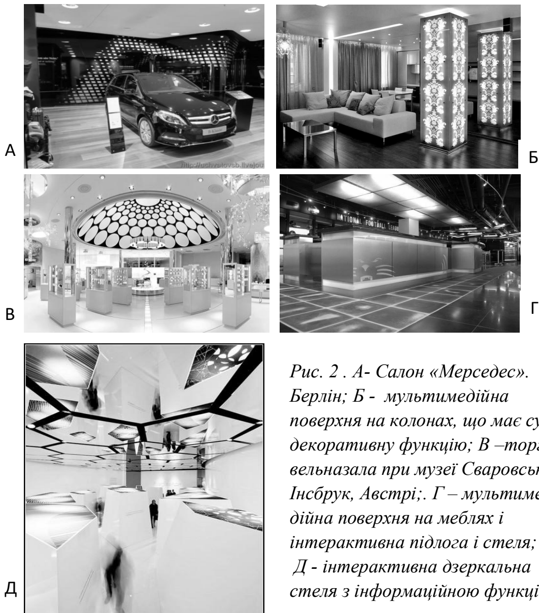
Рис. 2 . А- Салон «Мерседес». Берлін; Б - мультимедійна поверхня на колонах, що має суто декоративну функцію; В –торгівельна зала при музеї Сваровські». Інсбрук, Австрі;. Г – мультимедійна поверхня на меблях і інтерактивна підлога і стеля; Д - інтерактивна дзеркальна стеля з інформаційною функцією.

Поверхня, що має мультимедійне оснащення, може мати і чисто декоративну функцію (рис. 2 Б), і декоративно-композиційну – виконуючи роль композиційного центру (рис. 2 В). Ну і, звичайно, рекламну. Вона може бути розташована на будь-якій поверхні: на стінах, підлозі, стелі, колонах і навіть на меблях. (Рис. 2 Г, Д). Інтерактивні поверхні можуть змінювати колір, насиченість світла і малюнок, реагуючи на дотик, голос, або просто рух на