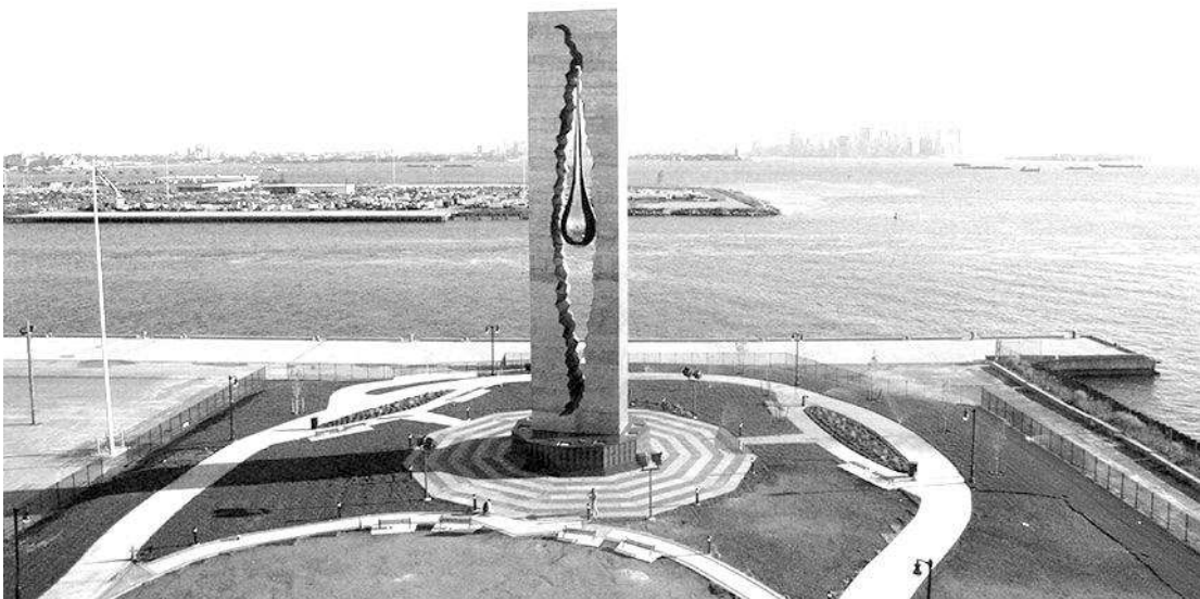
Рис 3. Монумент «Слеза скорби». З. Церетелі. США, Нью-Джерсі 2006 р.