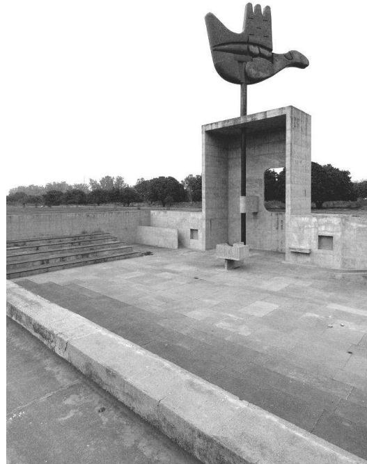
Рис 2. Монумент «Відкрита рука» Ле Корбюз'є. Індія, Чандігарх 1950-1965 р.