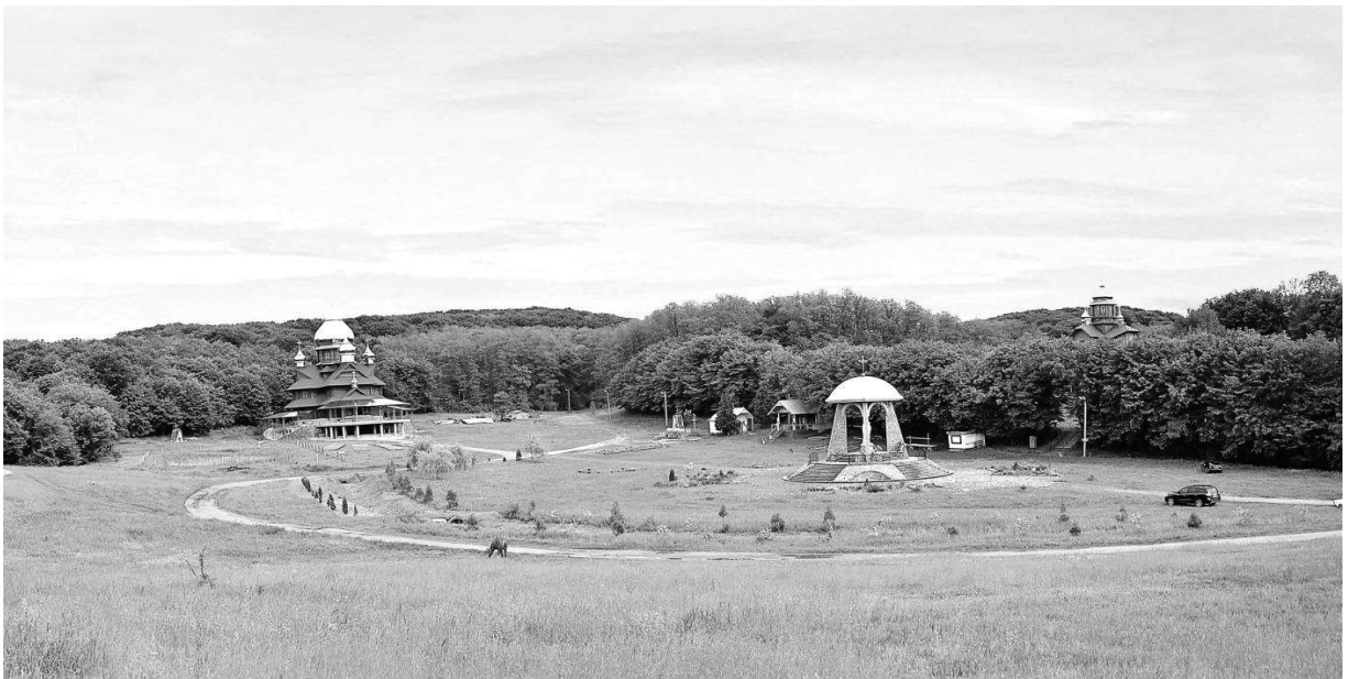
Рис. 1. Паломницький центр у с. Погоня, 2016 рік

Будівництво нової церкви та монастирських приміщень розпочалось ще перед Першою світовою війною, а завершилось вже перед Другою. За часів Радянської влади монастирські келії використовувались під господарські потреби. Один із корпусів монастиря використовувався як психоневрологічний інтернат, який існує дотепер.