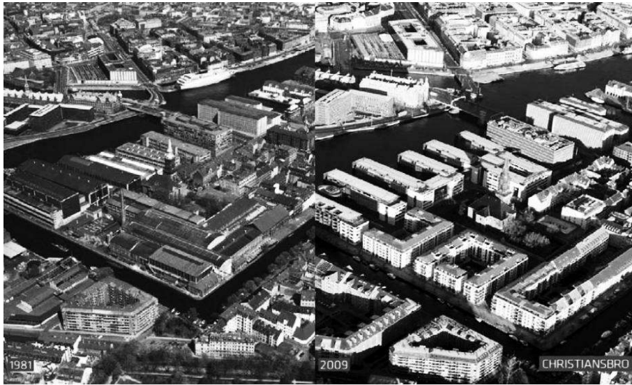
Іл. 1. Результати реурбанізації р-ну Christianshavn у Копенгагені (1981-2009) 4

Не можна оминати увагою і такий значимий спосіб дії середовища на пост-промислову територію, як її фрагментація . Подібні схеми активно застосовуються на територіях великої площі (більше 10 га), де по периметру ділянки відмежовуються по кількасот квадратних метрів для введення тієї чи іншої нової функції, затребуваної в середовищі, або для розвитку якої у даному місці виникли сприятливі обставини. Подібне вирішення можна спостерігати на території підприємства «ЛьвівСільмаш» у Львові, де частину ділянки було відведено для побудови житлового будинку, а частину на розі магістральних вулиць віддано в оренду підприємствам торгівлі та харчування.