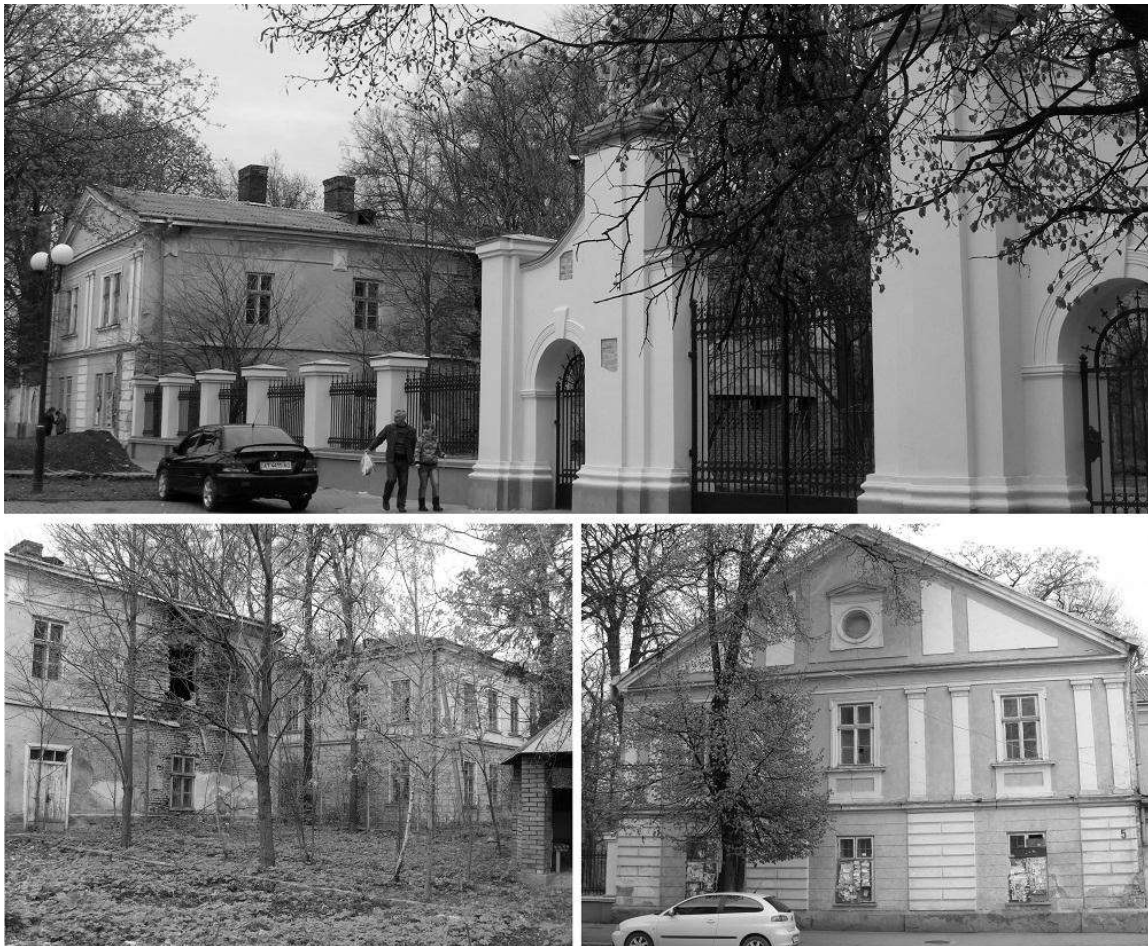
Рис. 3. Споруди Палацу Потоцьких в м. Івано-Франківську. Фото 2015р.

Найбільш негативними чинниками впливу на палац визначено близькість розташування ринків та несанкціонований паркінг, що межує із територією комплексу. Щодо плюсів, то це розташування комплексу в історичному ядрі міста та зв'язок території палацу із рекреаційною зоною. Розташування пам'яткового комплексу в збереженому історичному середовищі дає можливість його розкриття в контексті ансамблю центру міста.