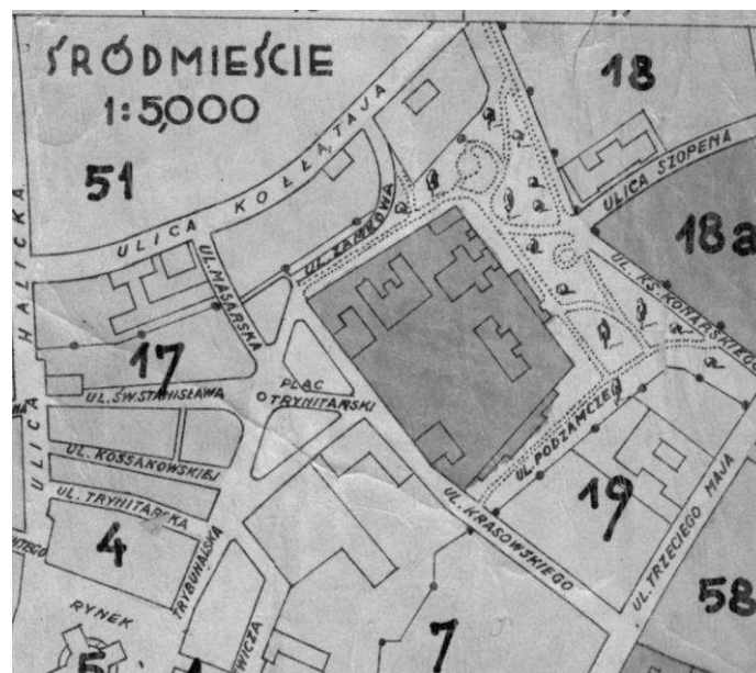
Рис. 1. Комплекс Палацу Потоцьких у Станіславові на карті "Plan miasta Stanisławowa, 1934."

На сьогоднішній день колишній палац складається із ряду споруд XVIII – XIX ст., які разом із територією колишнього партеру творять єдину композицію (Рис.1, 2). Технічний стан кожної з них вимагає проведення ремонтно-реставраційних робіт (Рис. 3). Територія комплексу обнесена триметровою мурованою стіною. Вхід на територію палацу здійснюється через муровану браму, яка поєднана із двома флігелями. Крім історичних споруд, на території комплексу розташовано кілька окремих об'єктів та прибудов радянського періоду. Вони, звісно, є дисгармонійними по відношенню до цінної історичної забудови.