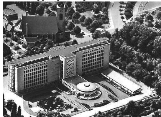
Рис. 8. Конторській будівлі «Шелл-Нідерланд» в Гаазі. 1938-42 рр. Арх. Якобус Йоганнес Пітер Оуд.

В архітектурі будинку Каси соціального страхування, в Чернівцях, Леон Сіліон використав прийоми об'ємно-просторової композиції, що базуються на поєднанні різновеликих паралелепіпедів, що є дуже популярним для світової практики функціоналізму. Примарія міста безкоштовно надала для новобудови земельну ділянку, адже не тільки в Румунії, а й в цілому Світі питання страхування стає надзвичайно популярним. Так на 30 вересня 1937 року кількість страхувальників в Чернівцях склала 33416 осіб. У зв'язку з цим будівля мала бути надзвичайно показовою і декларувати своєю архітектурою не тільки європейські, а й світові модні тенденції. Касу соціального страхування урочисто відкрили 18 червня 1937 року. Цей імпозантний триповерховий будинок був зведений за останніми досягненнями будівельної справи і обійшовся місту у 18 мільйонів лей. Для установи придбали необхідне медичне обладнання найкращої якості, обладнали рентген-кабінет, відділи дерматології та педіатрії, лабораторії, аптеку, лазню, відділ госпіталізації, а також адміністративні кабінети. В об'ємах чітко простежується функція, адже архітектура функціоналізму мала бути чесною і нічого не приховувати. У