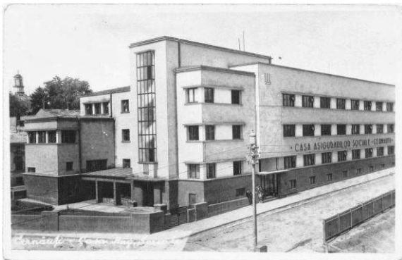
Рис. 9. Каса соціального страхування в Чернівцях. 1937 р. Арх. Леон Сілеон.

Ідея комбінування різних за розмірами об'ємів звичайно ж відсилає до архітектури комплексу BAUHAUS в Дессау, який запроєктував Вальтер Гропіус у 1925-26 рр. Будівлі Баухаузу є одними з найсимволічніших у архітектурі ХХ століття. Незважаючи на свій короткий період роботи (всього 7 років) та подальше запусіння протягом кількох десятиліть, ідеї, проголошені тут, значно провпливали на розвиток сучасної архітектури кількох поколінь. Увесь комплекс має чіткий і спокійний геометричний поділ з м'якими переходами вертикальних та горизонтальних сполучень, оштукатурених площин, віконних ліній та великоформатних скляних стін (Рис. 10).