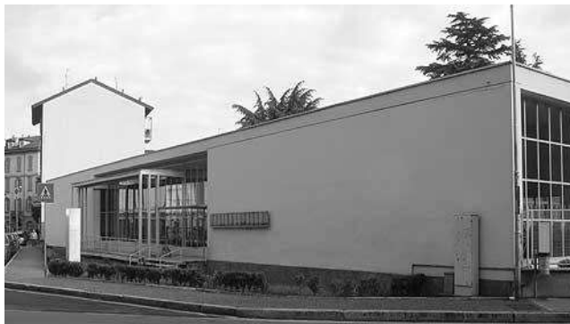
Рис. 3. «Народний» дім в Комо. 1932-36 рр. Арх. Джузеппе Терраньї.