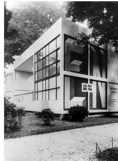
Рис. 2. Павільйон «Еспрі Нуво».

Всесвітня виставка декоративного мистецтва в Парижі. 1925 р.