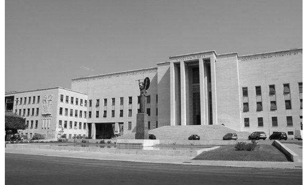
Рис. 6. Будівля головного корпусу Міського університету La Sapienza в Римі. 1930-ті рр. Арх. Марчелло П'яченціні.