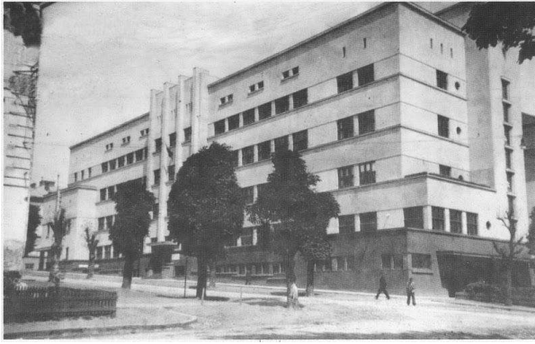
Рис. 5. Гуртожиток підмайстрів (бурса) імені Іона Ністора в Чернівцях. 1934-36 рр. Арх. Леон Сіліон.