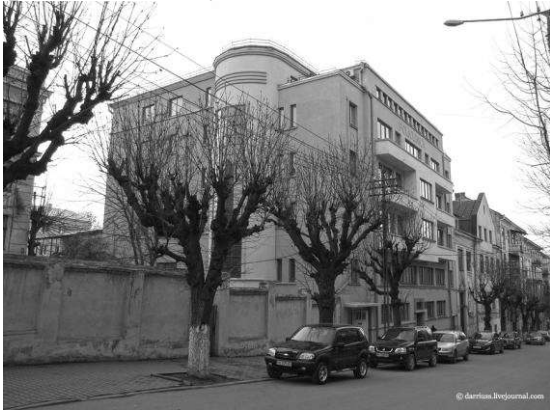
Рис. 11. Поліклініка в Чернівцях. 1937 р., Арх. К. Селеджану.

будинком у Відні завдяки своїй лаконічній вражаючій монументальності (Рис. 12). З часом, такий прийом виведення об'ємних балконів для збагачення пластики фасадів, стає дуже популярним елементом архітектури функціоналізму і в кінці 30-х років ним вже користуються у різних містах Європи та Світу.