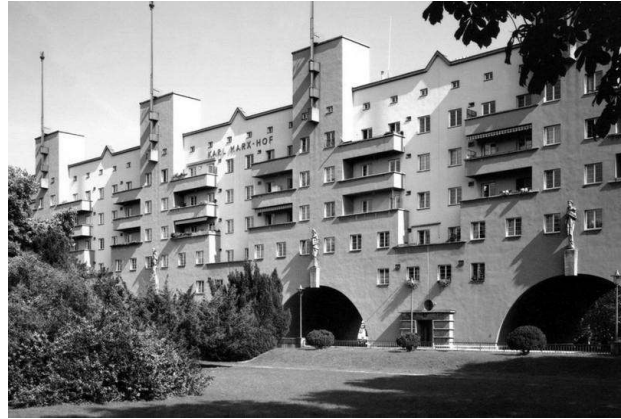
Рис. 12. Житловий комплекс Карл-Маркс-Гоф у Відні. 1927 р. Арх. Карл Ен.