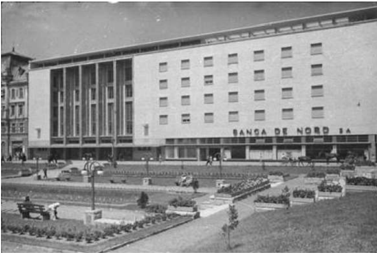
Рис. 1. Будинок Товариства румунської культури та літератури в Чернівцях.