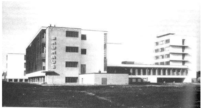
Рис. 10. Будинок школи BAUHAUS в Дессау. 1925-26 рр. Арх. Вальтер Гропіус.

Такі ж ідеї сповідував і Пітер Беренс, у 1927 році, проектуючи будинок на виставці житла Werkbund в селищі Вайсенхоф у Штутгарті. Там експонувалися роботи кращих архітекторів того часу, що призвело до її великої популярності. Тому ідеї, запропоновані на ній, отримали швидке розповсюдження у європейській та світовій архітектурі. В проектах Пітера Беренса яскраво проглядаються тенденції творення нових форм, які можна виготовляти промислово, що свідчить про його боротьбу за об'єднання ремесла, мистецтва та техніки. Прагнення спростити всі декоративні оздобы призвело до цілковитої геометризації архітектури і надання переваг функціональним якостям об'єкту та пошукам натуральних фактур матеріалів [11].