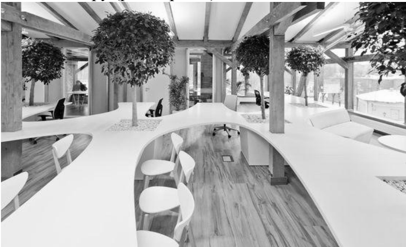
Рис. 2. Студія OpenAD офіс для компанії «Binarium» в Ризі, Латвія.

Створення комфортного внутрішнього середовища пов'язане з естетичними та екологічними властивостями рослин, де вони виступають регуляторами екологічної рівноваги середовища для людей, а також як елементи декору (рис.2, рис.3).