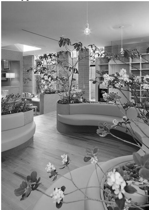
Медичний центр в Маямі

Об'ємно-просторові чинники. Об'єм природного саду в планувальній структурі, сприяє створенню особливого архітектурного образу будівлі, чіткості архітектурно-будівних елементів. Зв'язок внутрішнього простору будівлі з навколишнім середовищем, має відношення до організації функціональних процесів у будівлі, а тому і до формування його внутрішнього середовища, створює його композиційну структуру. Взаємодія композиції інтер'єру і зовнішнього середовища часто використовується в сучасній архітектурі й це є однією з основних задач архітектурного проектування (рис.1).