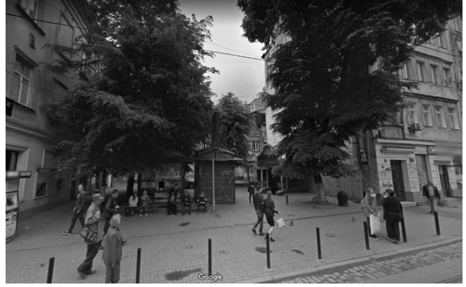
Рис. 3, 4. Площа на вул. Дорошенка, 9 до реконструкції (2016р.) [1].

Площа була некомфортна та хаотична, місця для сидіння - відсутніми. Розміщувалися МАФІ, а також літній майданчик, які витісняли загальнодоступний громадський простір. На площі росли чотири липи, які, скоріше за все, були висаджені тут після Другої світової війни (Рис. 3, 4).