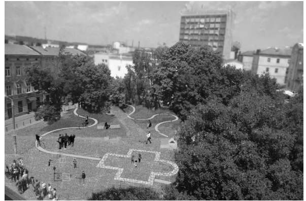
Рис. 17, 18. Площа Св. Теодора, фото візуалізації площі [3].

Площа Галицька. Автори концепції запропонували звужити проїжджу частину та поворот з Галицької площі на вул. Князя Романа. Звуження дороги дозволить розширити тротуар. На куті з'явиться можливість посадити дерева і створити невеликий громадський простір. Також концепція передбачає розширення посадкового майданчика біля зупинки громадського транспорту та облаштування смуги для громадського транспорту в напрямку з проспекту Свободи на Соборну площу (рис. 19).