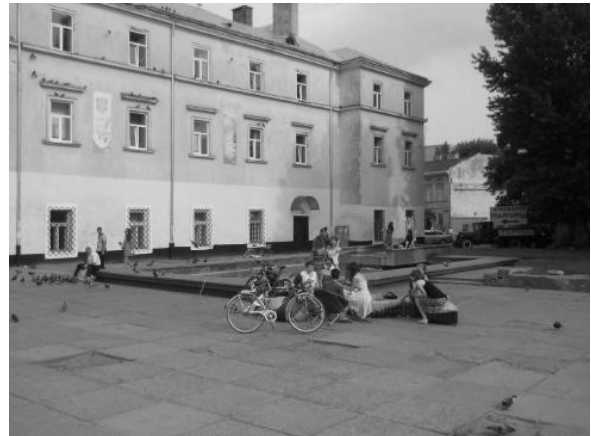
Рис. 1, 2. Площа Митна до реконструкції (2013р.) [5]

Перехожі не могли знайти музей Пінзеля, також в незадовільному стані перебував підземний перехід, сходи що вели до площі, та старе бетонне покриття. На площі були відсутні мінімальні засоби забезпечення комфорту – бракувало місць для сидіння, зелених насаджень та захисту від сонця (рис. 1, 2).