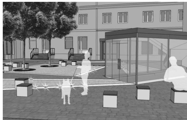
Рис. 13, 14. Площа на вул. Дорошенка, нинішній стан. Фото візуалізації площі [1].