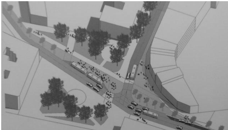
Рис. 19. Площа Галицька, фото візуалізації площі [4].

Площа Галицька. Автори концепції запропонували звужити проїжджу частину та поворот з Галицької площі на вул. Князя Романа. Звуження дороги дозволить розширити тротуар. На куті з'явиться можливість посадити дерева і створити невеликий громадський простір. Також концепція передбачає розширення посадкового майданчика біля зупинки громадського транспорту та облаштування смуги для громадського транспорту в напрямку з проспекту Свободи на Соборну площу (рис. 19).