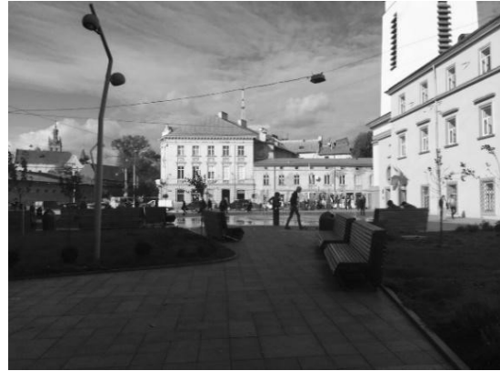
Рис. 11, 12. Площа Митна після реконструкції.

На площі Митній залишилася бронзова скульптура хлопчика, що плюскається водою: її почистили та оновили. У мощенні закладено майже сто одноватних світильників, що плавно сконцентровуються до входу у Музей Пінзеля – до основної домінанти площі (Рис. 11, 12).