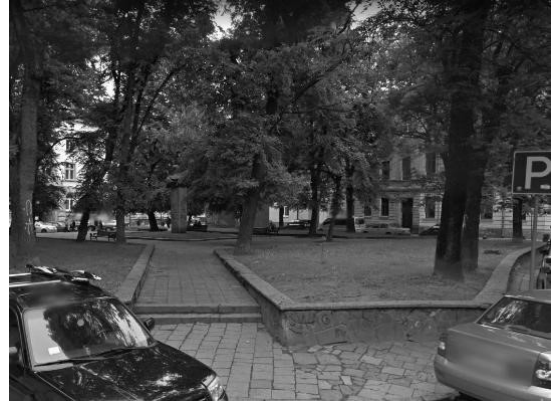
Рис. 5, 6. Площа Є. Маланюка до реконструкції (2016р.) [2].

На площі Маланюка до реконструкції була присутня активність проблемних соціальних груп, а це створювало небезпеку для відпочиваючих дорослих та дітей. Була потрібною реставрація підпірних стінок, мощення, та сходів, також в незадовільному стані знаходилися лавки для сидіння та смітники. Відсутність вуличного освітлення на території породжувало чимало проблем та незручностей мешканцям.