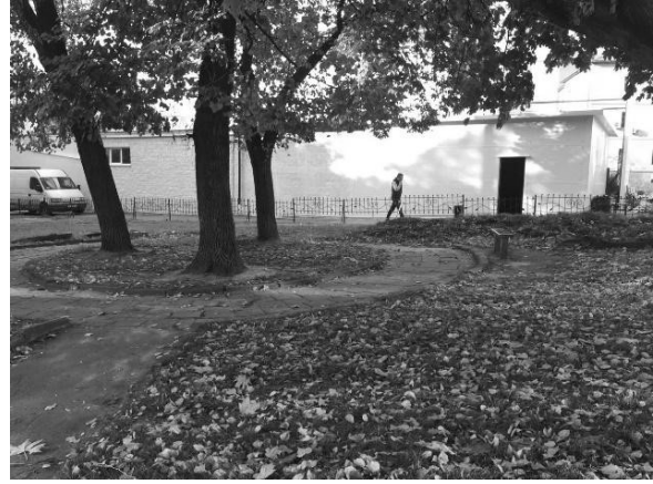
Рис. 7, 8. Площа Святого Теодора на сьогоднішній день. (13.10.2017р.)

Благоустрій площі з непривабливим дизайном та перебуває в жахливому стані: неякісне мощення, бордюри створюють бар'єр, немає відповідного покриття для велосипедів, роликів; відсутні місця для сидіння; недостатньо смітників; замало озеленення та брак ліхтарів [3].