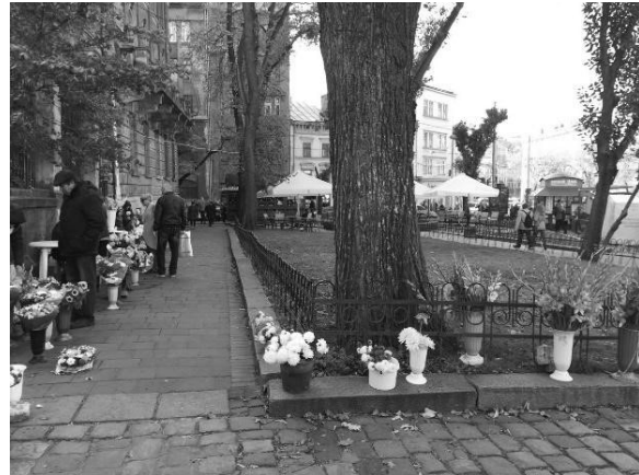
Рис. 9, 10. Площа Галицька на сьогоднішній день.

На площі змішались продавці квітів, МАФи, фонтан, літній майданчик, та потоки прохожих людей (Рис. 9, 10). Мощення в незадовільному стані, бордюри створюють бар'єри для МГН. Бракує місць для сидіння, вуличного освітлення, захисту від сонця – а отже, комфорту для тих, хто хоче залишитись на площі [4].