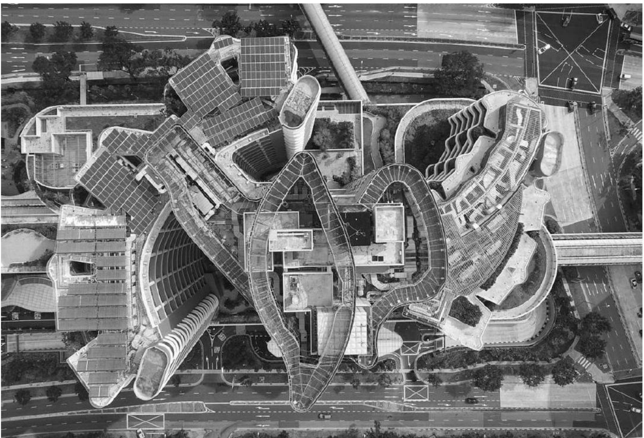
Рис. 2 Вид зверху на комплекс лікарень Ng Teng Fong (NTFGH) і Jurong (JCH), Сінгапур, 2015 р., архітектурна фірма CPG Corporation