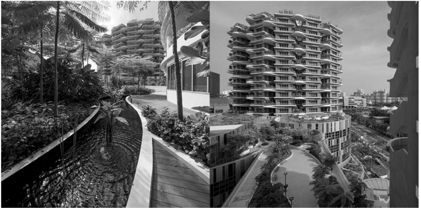
Рис. 3 Активне використання озеленення на зовнішніх об'ємах будівель комплексу лікарень Ng Teng Fong (NTFGH) і Jurong (JCH), Сінгапур, 2015 р., архітектурна фірма CPG Corporation