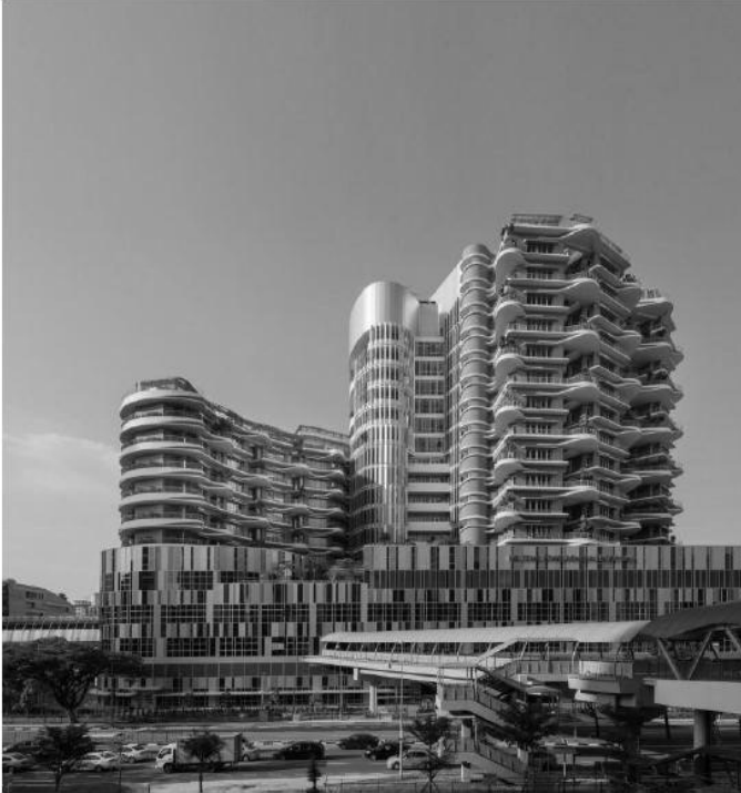
Рис. 5 Головний фасад комплексу лікарень Ng Teng Fong (NTFGH) і Jurong (JCH)