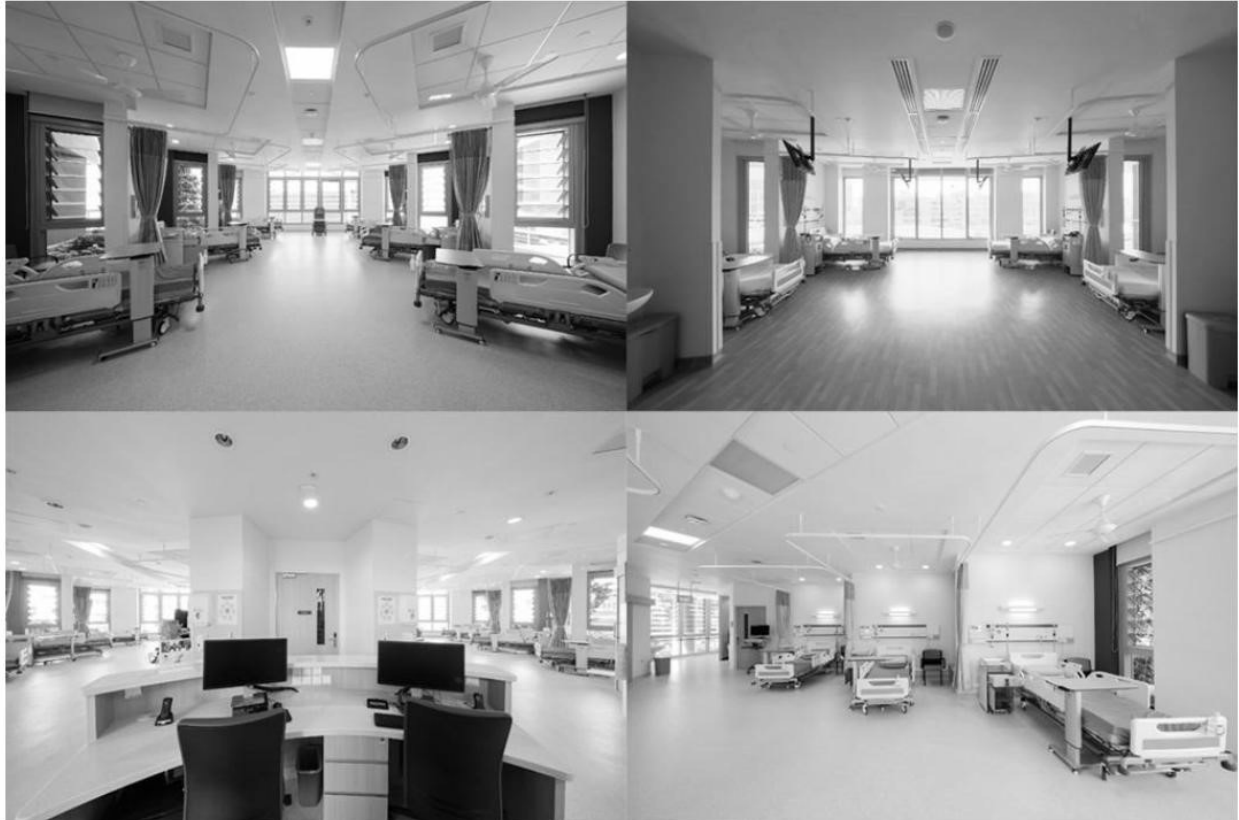
Рис. 8 Інтер'єри лікарень Ng Teng Fong (NTFGH) і Jurong (JCH)

Для запобігання розповсюдженню внутрішньо лікарняних інфекцій архітектори завдяки комп'ютерному моделюванню на етапі проектування обчислили напрями потоку вітру таким чином, щоб вітер не проходив через кілька пацієнтів.