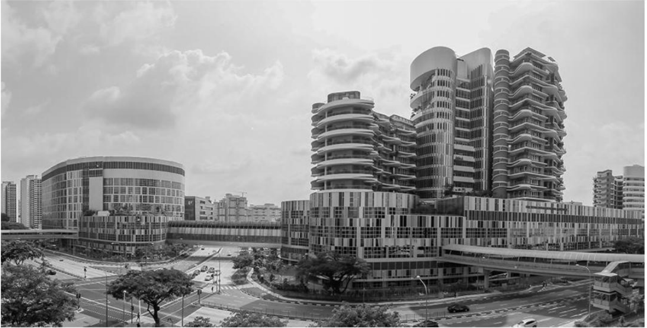
Рис. 1 Загальний вигляд комплексу лікарень Ng Teng Fong (NTFGH) і Jurong (JCH), Сінгапур, 2015 р., архітектурна фірма CPG Corporation