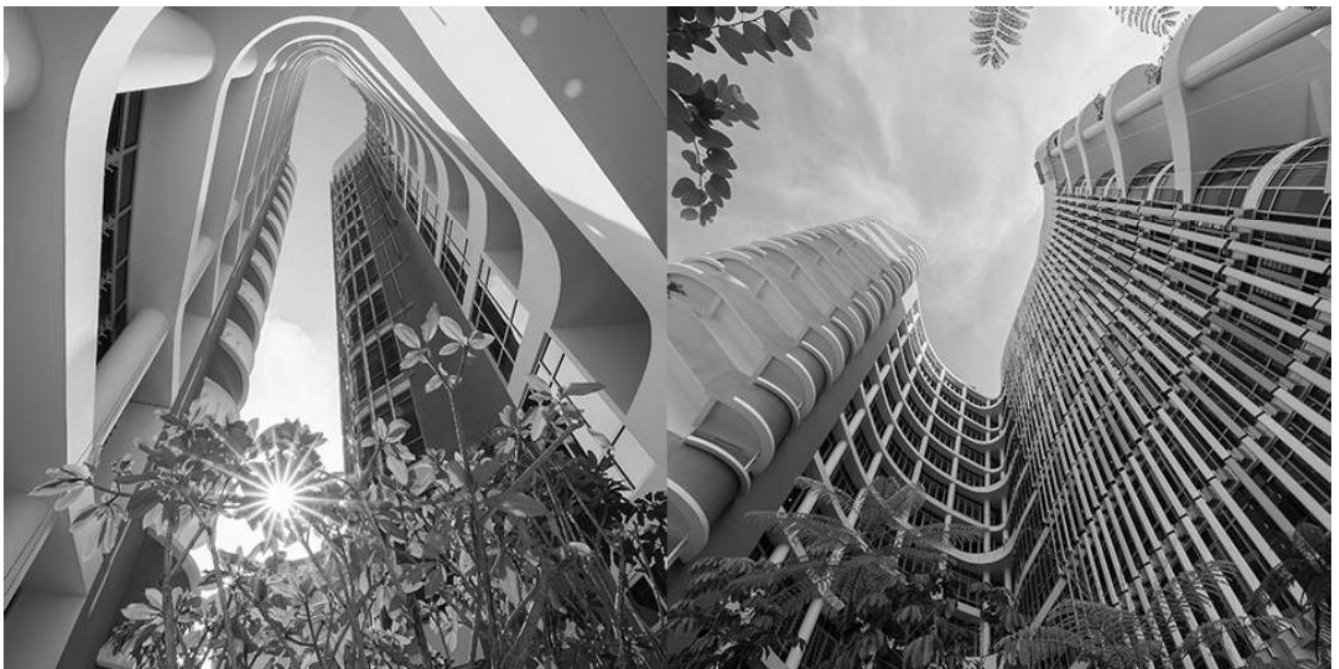
Рис. 4 Пластичність об'ємно-просторових форм і фасадів комплексу лікарень Ng Teng Fong (NTFGH) і Jurong (JCH), Сінгапур, 2015 р., архітектурна фірма CPG Corporation