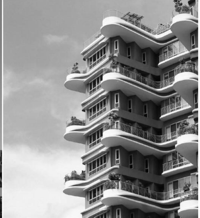
Рис. 6 Фрагмент фасаду комплексу лікарень Ng Teng Fong (NTFGH) і Jurong (JCH)