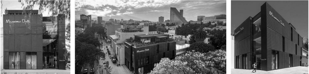
Рисунок 4. магазин Massimo Dutti, Мехіко, арх. фірма Sordo Madaleno Architects.

робить акцент на головний вхід та поєднує всі рівні об'єкта. Експлуатована покрівля використовується як певна лаунж-зона, а також для проведення міні-показів продукції [7].