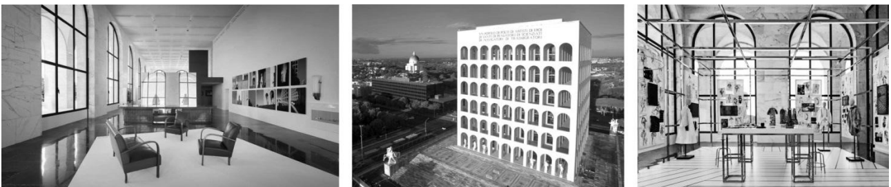
Рисунок 4. Будинок моди Fendi, Рим, арх. бюро Marco Costanzi.

Виявлений прийом розташування будинків моди в об'єктах, які відносяться до пам'яток архітектури (рис. 4). У 2015 році італійський будинок моди Fendi відкрив у Римі свою нову штаб-квартиру. Відреставрована монументальна пам'ятка архітектури "Палац італійської цивілізації" розмістила на площі 15000 метрів квадратних виставкову залу, книжковий магазин, кафе, лаундж зони, конференц зал та офіси [6].