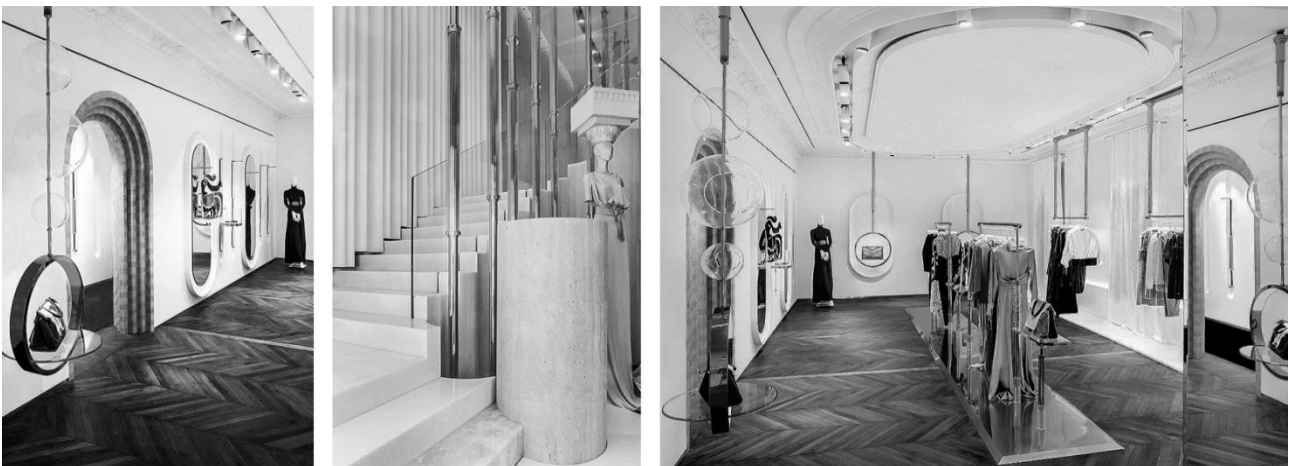
Рисунок 2. Бутик Madeleine Vionnet, Франція, дизайнер Renato Montagner.

Бутик французького бренду Madeleine Vionnet (рис. 2) знаходиться на першому поверсі офісної будівлі виконаної в класичному стилі. Інтер'єр бутику виконаний Renato Montagner. Поєднання різних фактур, таких як: матові та глянцеві, тканини, дерева, каменю – одночасно зберігає атмосферу 20 років двадцятого століття та вносить сучасні ноти. Використання округлих та овальних форм у поєднанні з освітленням робить акцент на брендових речах, таку подачу порівнюють з музейною.