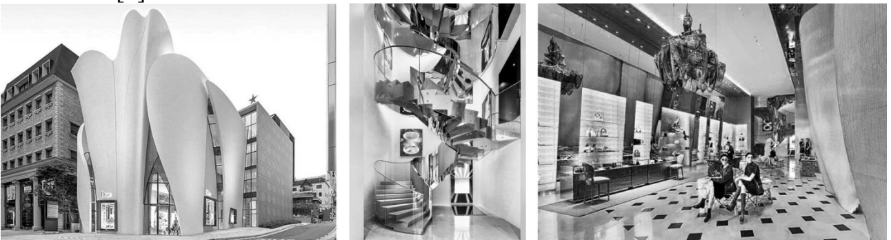
Рисунок 5. Бутік Christian Dior, Сеул, архітектор Крістіан де Портзампарк.

Ще один приклад будівлі, яка повністю присвячена бутику, в даному випадку – Christian Dior, знаходиться в Сеулі (рис. 5), та має шість поверхів. Образ даного об'єкту стає повним контрастом до навколишньої забудови, має пластичні форми, що взяли свій початок з певної асоціативної ланки – імітація легких шовкових тканин. Акцентом інтер'єру стають масивні спіральні сходи, що ведуть на дах, де розташоване кафе, та витончені люстри задрапіровані тканиною [8].