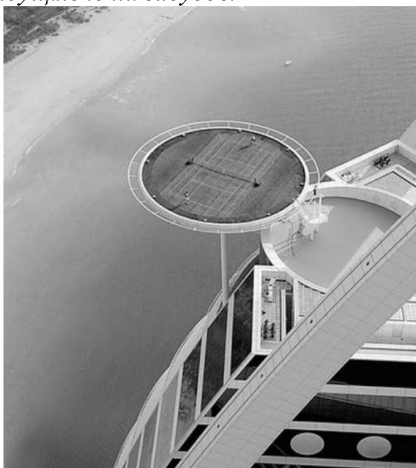
Рис.1. Тенісний корт на покрівлі готелю Бурдж аль-Араб , Дубаї. [4]

За браком місця поряд із будівлею під розташування дитячих майданчиків, спортивних комплексів, кінотеатрів, а також садів і парків, сучасні архітектори влаштовують подібне на дахах або терасах висотних будівель. Прикладом чого може слугувати доволі сміливе рішення розташування спортивного майданчика в готелі Бурдж аль-Араб у Дубаї. Найвищий тенісний корт (Рис.1), круглий за формою плану, у разі відсутності спортивних змагань на ньому, слугує вертолітним майданчиком на висоті 211 м над рівнем моря. Не менш оригінальним спортивним майданчиком (Рис.2) є той, що розмістився на даху в'язниці у Чикаго. [4] І прикладів подібного у світі тисячі, принаймні там, де є актуальним розширення громадського простору у надущільненій забудові .