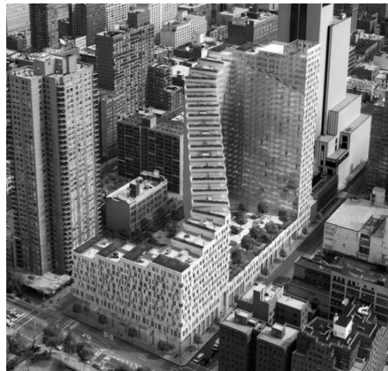
Рис.4. ЖК «Clinton Park», США. [7]

В умовах надущільненого об'єктного середовища та й історичної частини міста слід звертати увагу на навколишню забудову, аби гармоніювати з нею без спотворення архітектурної спадщини. Тим самим виключаючи наднормовані затінення сусідніх будинків чи парків та забезпечуючи оптимальні показники аерації, провітрювання і відсутність значних протягів.