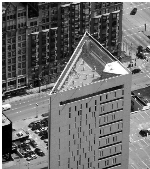
Рис.2. Спортивний майданчик на покрівлі тюрми, Чикаго. [4]