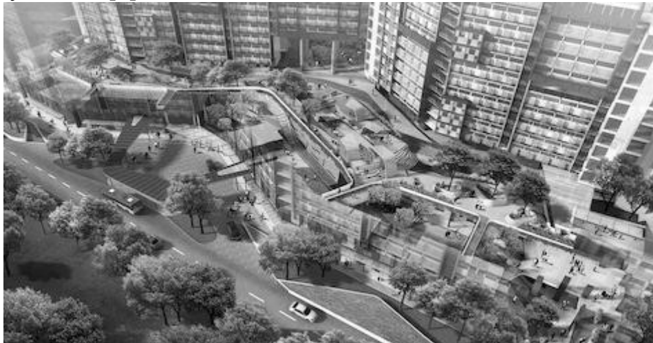
Рис.5. NTU Hall of Residence, Сінгапур. [8]

Винятковим можна вважати житловий комплекс у Сінгапурі (Рис.5) з чотирьох 13-поверхових житлових будинків та чотириповірховою автостоянкою, що входить у склад ландшафтно облаштованого стилобату, довжиною 185 метрів. Стратегія дизайну полягала у створенні динамічних умов для спільної взаємодії між мешканцями у різних приміщеннях і на відкритому повітрі. Об'єкт був спроектований саме за розглянутим принципом використання прибудинкової території не на одному рівні з основною вулицею, а у площині п'ятого поверху над автостоянкою, де і забезпечується доступ до житлових будинків. [8]