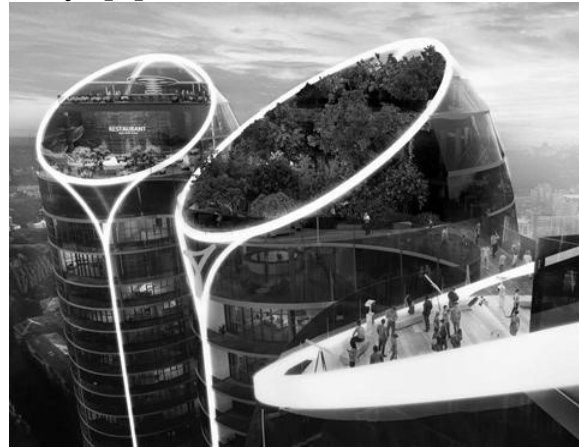
Рис.7. ЖК «Taryan Towers», Україна. [9]

У нашій країні екологічне будівництво лише набирає обертів у даному напрямі, чому сприяють набутий іноземний досвід з екологічного будівництва, а також впровадження міжнародних стандартів [10]. Екологічне будівництво для України поки, що недостатньо розкрито, але є великий потенціал, перспектива для економічного зростання і шлях до сталого розвитку країни.