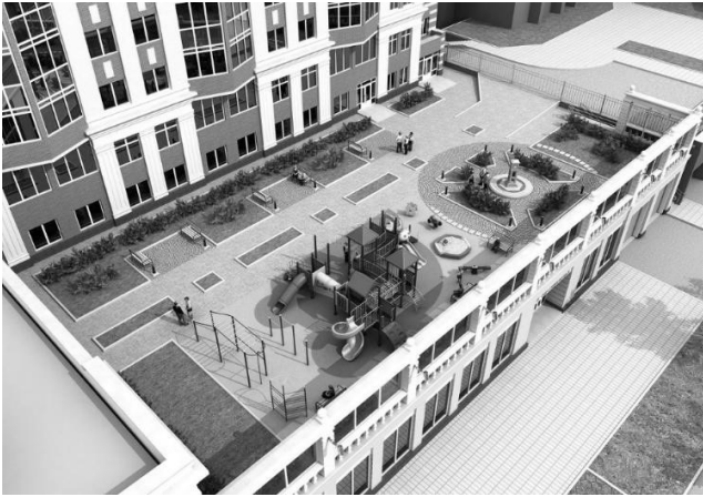
Рис.6. ЖК «Аристократ», Росія. [11]

іншій - парк, а на останній – музей сучасних технологій. При тому, що ці три верхні тераси, що вінчають окремі будинки, планується об'єднати між собою застосовуючи переходи або мости для пішохідного сполучення співмешканців і тих, хто завітав до комплексу. [9]