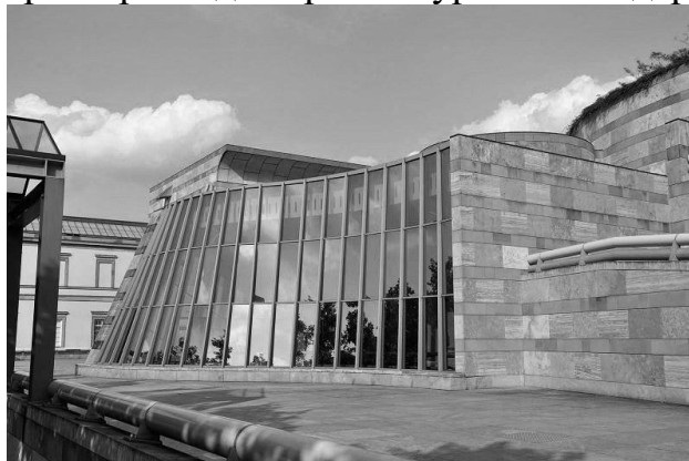
Рис.3 Архітектор – Джеймс Стерлінг, Державна галерея в Штутгарті

Пізня робота Джеймса Стерлінга – прибудова до Державної галереї в Штутгарті, мабуть, являється прикладом найбільш гармонійного поєднання різних стилів, таких характерних для архітектури постмодернізму (рис.3).