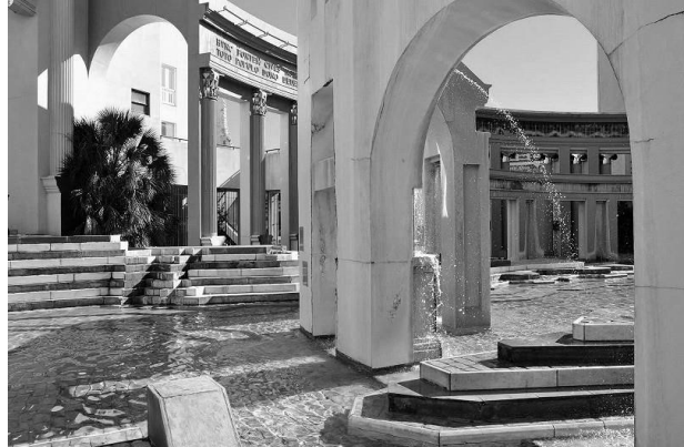
Рис.2 Площа Італії Чарльза Мура в Новому Орлеані (1976-1979 рр.)

З тих пір, поєднуючи елементи постмодерністського напрямку, а саме – іронічні ефекти, декоративні елементи, історичні цитати та символічні форми, багато архітекторів, натхнених самим поняттям «постмодернізм», продовжували виділяти елементи стилю з постійним акцентуванням форм. Проте за такого іронічного використання архітектурної мови, яка орієнтована на минуле лише як на спосіб створення нових форм, іноді постає прагнення уникнути будь-яких інновацій. Тому при розгляді постмодернізму як архітектурного жанру кожна наступна реактулізація може бути лише стилізацією і навіть мати риси фетишизації, що відображує заідеалізоване ставлення до створення архітектурних форм [2, 3].