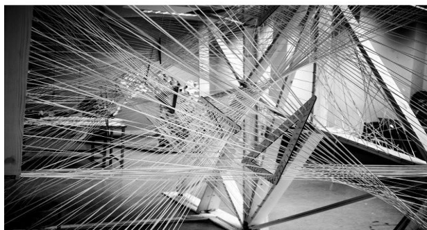
Рис. 6. ITKE Research Pavilion та "Kinetic Haze", Athens Athens Visiting School та University of Stuttgart

Висновки. Користуючись досвідом, творці мають визнати іншу концепцію постмодерну. Це буде спосіб гри з мовою, цінностями та концепціями, відмова від консенсусу щодо загального смаку, який може привести до ностальгії. Для втілення такої концепції необхідно щоб «постмодернізм» перетворився в частину нової глобальної стильової течії, наприклад, «параметризм», який намагається творити більш інтелектуально побудований світ. Цілеспрямована архітектура параметризму має включати в себе гнучкість програми, формування навколишнього середовища та контекстуалізацію в міській тканині. Параметризм готовий стати основним рухом сучасної архітектури на тлі стильової війни.