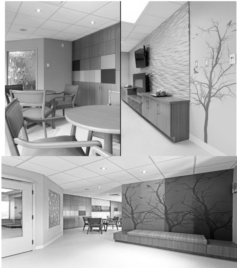
Рис. 1. Дизайн інтер'єрів вестибюльної зони вілли «Colombo», арх. «Ambience Design Group», м. Торонто, 2008

Сучасний багатофункціональний будинок для людей похилого віку, розміщений в м. Торонто (рис.1), представляє собою багатофункціональний комплекс для людей з хворобою Альцгеймера. Кінцевою метою формування яскравого та колоритного дизайну, розроблених інтер'єрів стало забезпечення середовища, що відрізняється високим рівнем безпеки, можливостями для здорової та мотивуючої атмосфери, в той же час, даючи відвідувачам відчуття тепла та затишку. В інтер'єрі рекреації розроблена зона аудіо-візуальна терапії, де розміщується акваріум. Всі елементи меблевої гарнітуру та оббивка були підібрані для проекту з метою створення якісних і практичних умов для відпочинку і проведення дозвілля. Природне освітлення медичного закладу вирішено за допомогою численних панорамних вікон. А художньо-естетичне рішення – виконано у колоритній та насиченою манері.