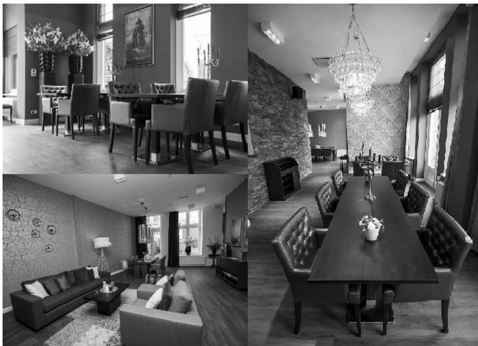
Рис. 2. «Residence Haganum», арх. «All-In Living», м. Гаага, 2012

Інтернат для людей похилого віку вілла «Colombo» в м. Торонто – чудовий приклад того, як можна обладнати споруду соціального призначення із забезпеченням комфортного життя та відпочинку пенсіонерів з хворобою в затишних.