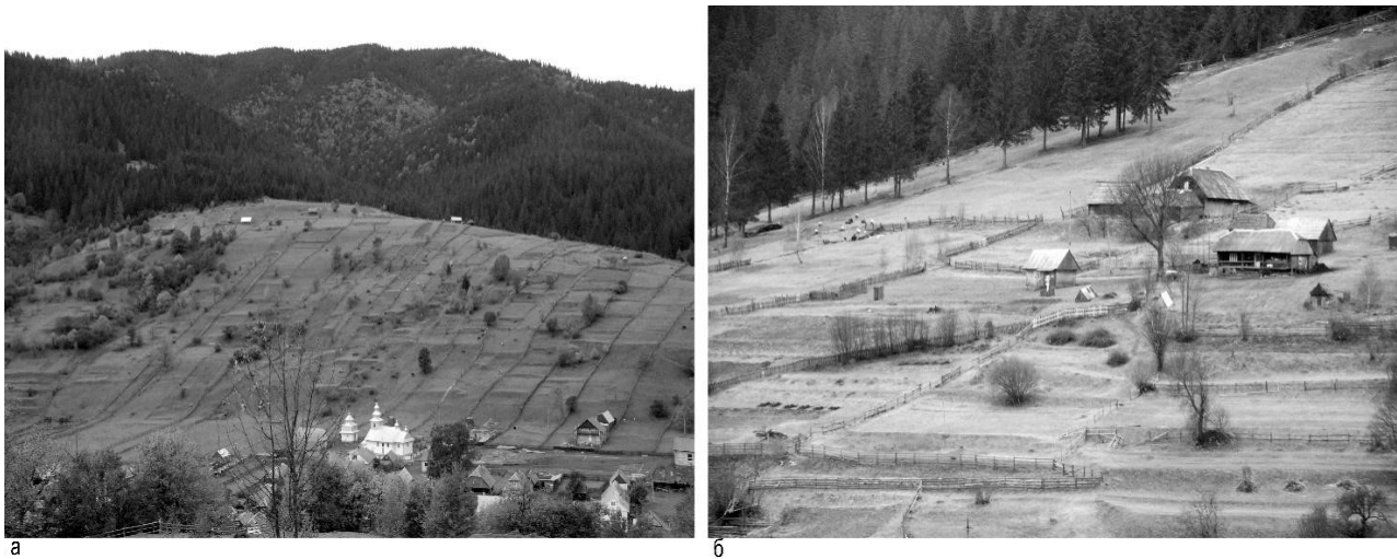
Рис. 3. Два типи традиційного агроландшафту села Синеvirська Поляна: а) початкова стадія розвитку (забудова у долинному просторі); б) завершальна стадія розвитку (забудова на верхніх рівнях)

Відповідно до законодавства України культурні ландшафти рекомендують відносити до об'єктів культурної спадщини, оскільки на них поширюється дія закону «Про охорону культурної спадщини», хоча вони одночасно знаходяться і під захистом закону «Про природно-заповідний фонд України». Проблема полягає в тому, що на Бойківщині немає прикладів занесення сільських культурних ландшафтів до переліку пам'яток культурної спадщини за видом визначні місця . До того ж, потреба охорони та потреби використання, розвитку і управління ландшафтами часто вступають у конфлікт між собою. Якщо пам'ятки архітектури чи містобудування можна зберегти у незмінному стані, то ландшафти у силу своєї динамічності та циклічності неможливо утримувати у незмінному стані.