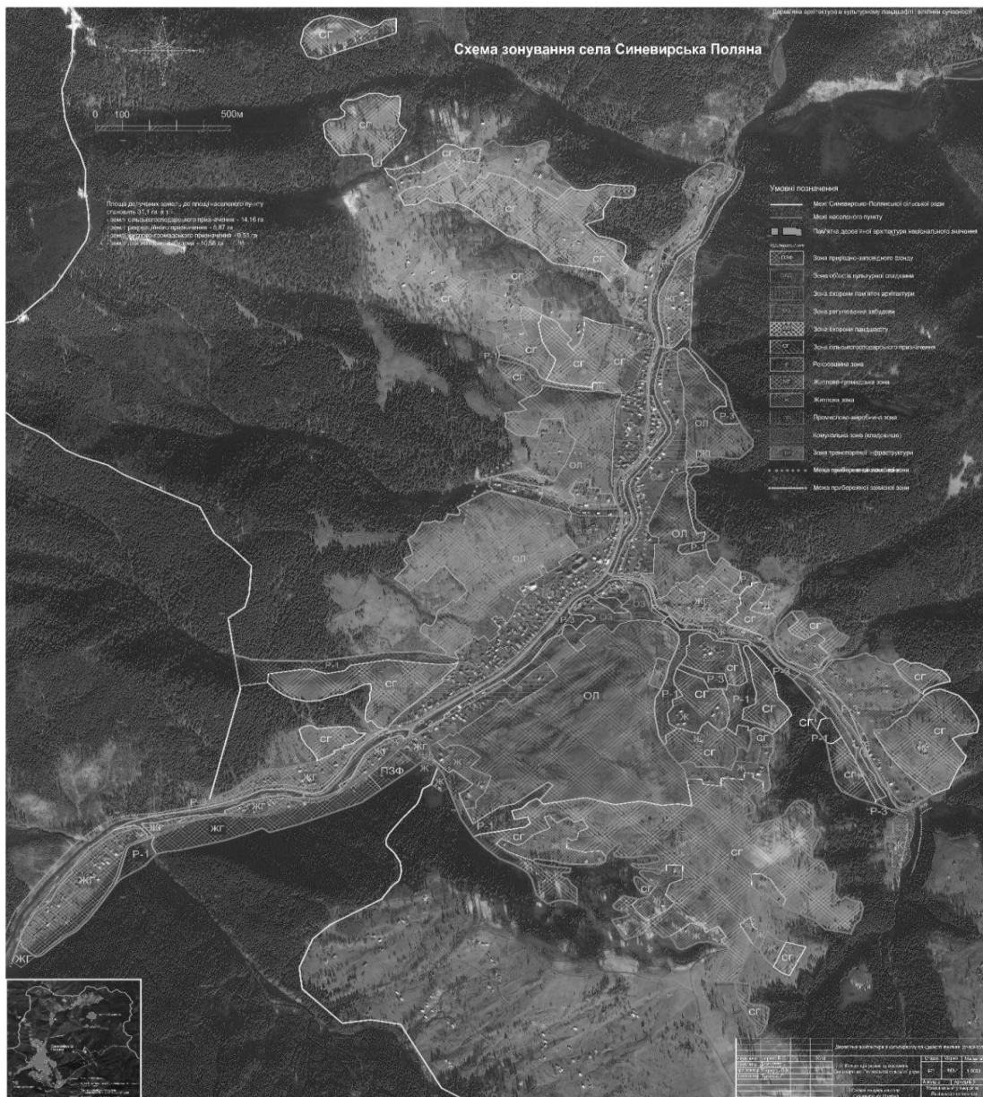
Рис. 4. Схема зонування села Синевирська Поляна Міжгірського району Закарпатської області

певних меж. Кожна зона наділялася своїм диференційованим правовим статусом. При цьому поряд із встановленням деяких видів стимулювання містобудівної діяльності вводилися певні обмеження на окремі види землекористування. На схемах відображені інші (крім територій загального користування) земельні ділянки, на які не встановлюється і не поширюється дія містобудівних регламентів, зокрема, територія природно-заповідного фонду та територія пам'ятки архітектури. Додатково встановлювались пам'яткоохоронні, водоохоронні та санітарно-захисні зони, які передбачали додаткові обмеження на використання земельних ділянок.