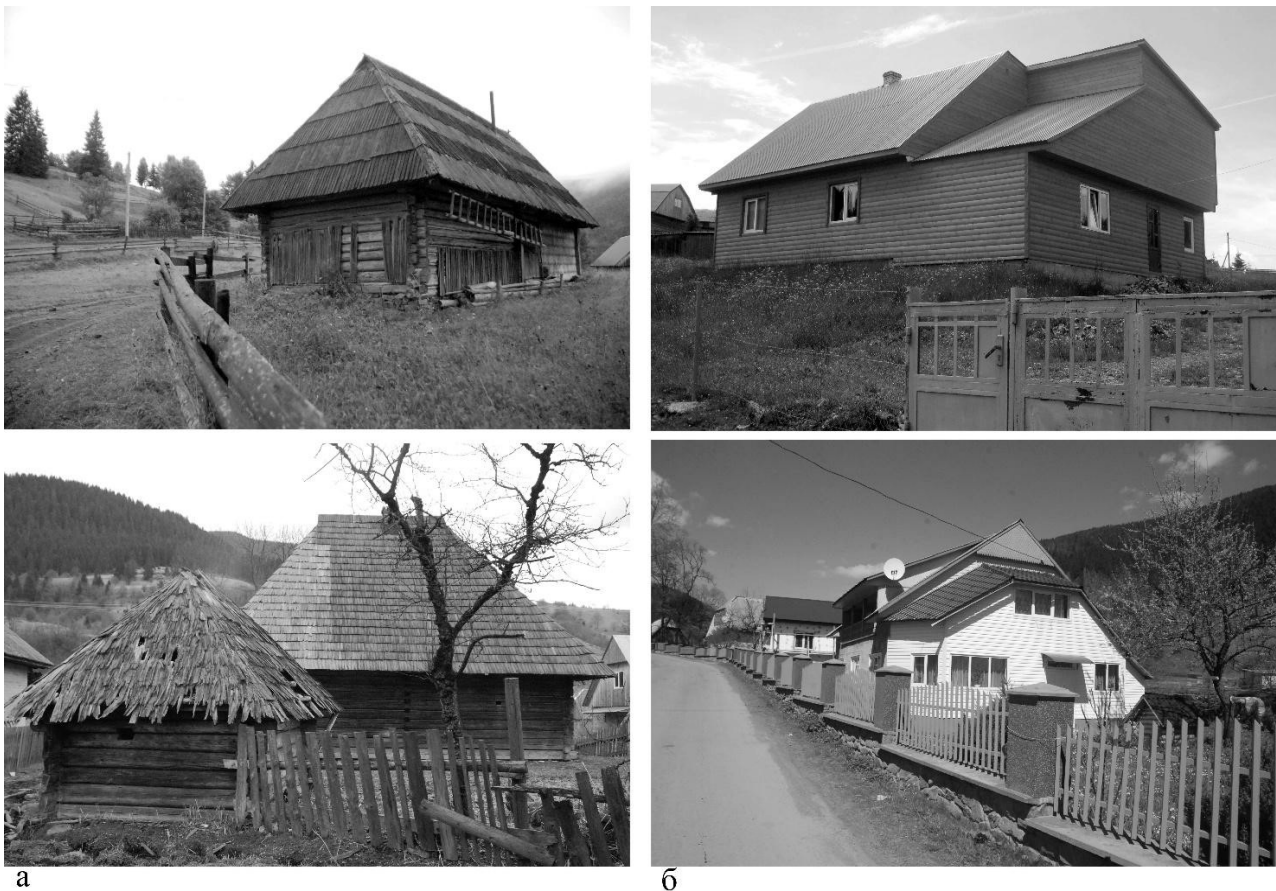
Рис. 1. Традиційні дерев'яні (а) та новітні (б) житлові будинки в культурному ландшафті Бойківщини

В Декларації про зберігання історичних міських ландшафтів розкривається головна проблема сучасної архітектури – знайти таку відповідь на динаміку розвитку, щоб сприяти соціально-економічним реформам та зростанню, одночасно оберігаючи успадкований міський ландшафт, та його об'ємно-просторову композицію. З огляду на проблеми, що постали перед охороною історичних міських ландшафтів, Генеральна Асамблея одним із пунктів підкреслює необхідність коректного включення сьогоденної архітектури у контекст історичного міського ландшафту [20]. Цю вимогу можна віднести не тільки до історичних міських ландшафтів, але й до традиційних сільських культурних ландшафтів, які втрачають свої якості та цінність через появу нових (часто вульгарних) архітектурних форм, недоречних колористичних рішень та нових матеріалів [21] (див. рис.1).