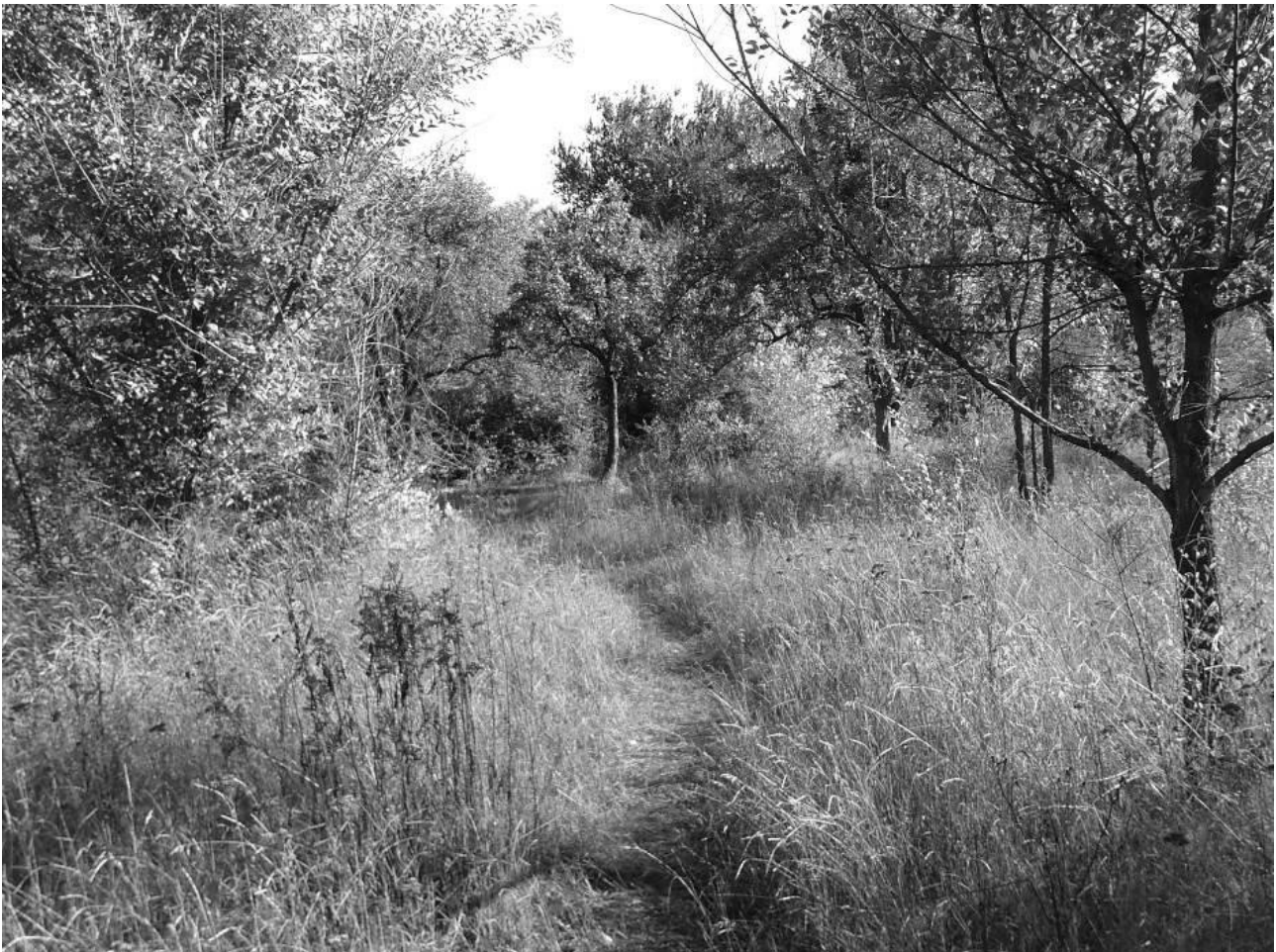
Рис. 1. Сучасний вигляд території центру

Нажаль, територія центру – це малі рекреаційні території, що не виконують своїх основних функцій, мають неорганізовані входи; маршрути та зони обслуговування знаходяться у занедбаному стані та потребують реновації; зелена зона – хащі; об'єкти малих архітектурних форм, громадський туалет, елементи освітлення та ландшафтного дизайну відсутні (рис.1).