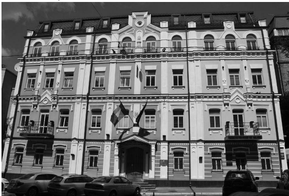
Італійський інститут культури, м. Київ, вул. Ярославів Вал