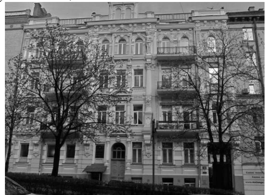
Французький інститут культури, м. Київ, вул. О. Гончара, 84