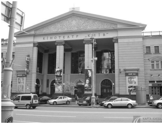
Культурний центр столиці, м. Київ, вул. Велика Васильківська, 19