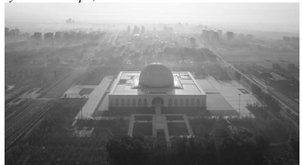
Мусульманський культурний центр у Китаї, 2015, арх. Хе Цзиньтан