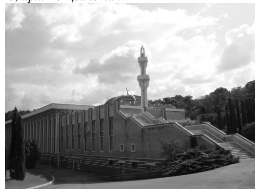
Соборна мечеть і центр ісламської культури в Римі, 1995, арх. П.Портогезі