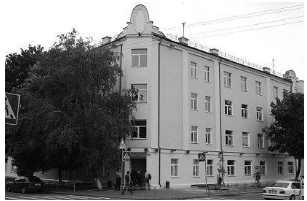
Німецький культурний центр, м. Київ, вул. Волоська, 12/4