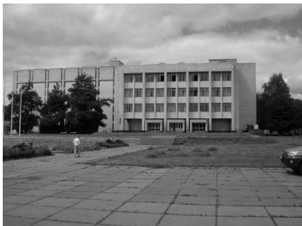
Японський культурний центр у корпусі Київського політехнічного інституту, просп. Перемоги, 37 м. Київ