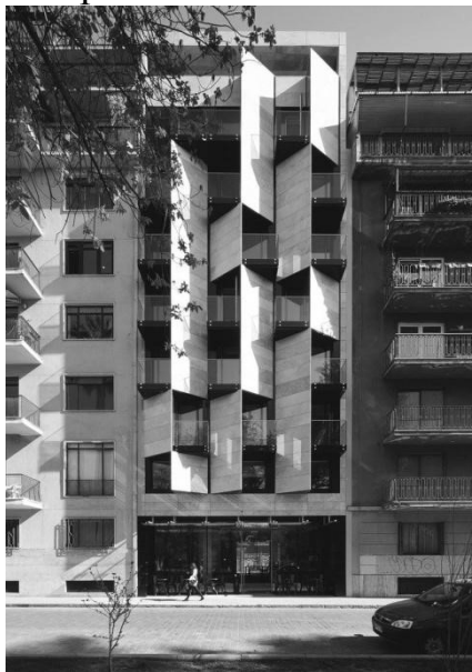
Рис.1. Ismael 312 ApartHotel / EstudioLarrain, Чілі

Яскравим прикладом апарт-готелю слугує Ismael 312 ApartHotel, Чілі. Це невеликий готель, який виділяється завдяки своєму навколишньому середовищу, адже це приклад інтеграції сучасної архітектури в історично сформоване середовище. Площа об'єкту становить лише 180 м 2 (9х20 метрів), звідки відкривається вид на дві вулиці, Ізмаїл Вальдес-Вергара та Монітас. Конструкція корпусу, що містить кімнати, має балкони з кожної спальні, які, як і решта блоку, представлена як виразний та об'ємний елемент [7].