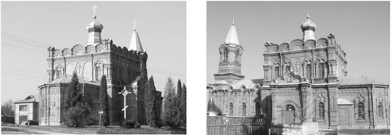
Рис.2. Полкова церква XIX ст. у місті Кременці Тернопільської області, 1986 р.

Тернопільської області (2005 рік); церкви Покрови у селі Свіршівці Чемирівецького району Хмельницької області (2008 рік) [1, с.194 – 199].