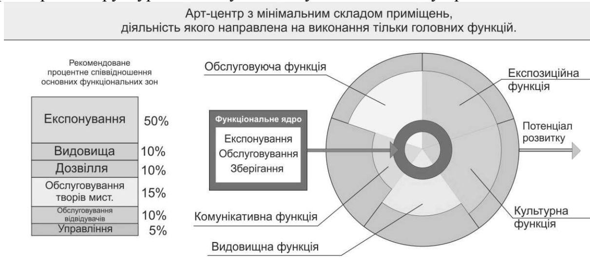
Рис.1. Тип I «Мінімальний»

центру мінімального типу визначається з врахуванням локальних умов (наявність мистецького осередку, недостатність представлення певної функції в місті/поселенні). Функціональні зони розташовуються в одній планувально-просторовій структурі або можуть поєднуватися в одному приміщенні.