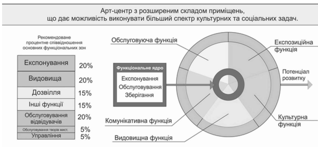
Рис.3. Тип III «Розширений»

Даний тип має перспективи застосування при проектуванні арт-центрів у великих містах, обласних центрах.