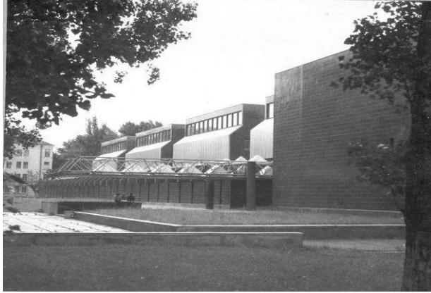
Рис.10. Архітектурний факультет інженерно-будівельного інституту (КНУБА). Арх. Л. Філенко, В. Коробка, М. Гершензон, інженер Л. Лінович. 1982 р.