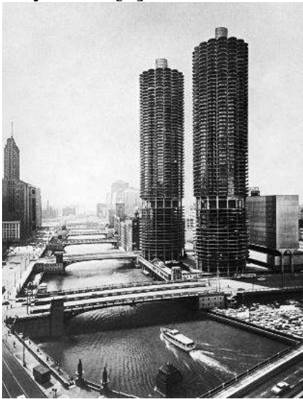
Рис. 1. Багатофункціональний комплекс Марина Сіті. Арх. Б. Голдберг. 1960 – 1964 р.

Однією з центральних проблем для архітектури як капіталістичних, так і соціалістичних країн досліджуваного періоду була проблема подолання монотонності індустріальної забудови. Архітектори різних країн активно шукали нові методи формотворення. Прикладом є творчість американського архітектора Б. Голдберга, який широко використовував криволінійні форми в проектуванні житлових та громадських будівель, де характерними були круги та їх комбінації а також форми, запозичені з живої природи. Оригінально вирішені автором будівлі лікарень в Чікаго, Такома, Гарварді, багатофункціональний комплекс Марина Сіті в Чікаго (рис. 1, 2), та багато інших будівель[1].