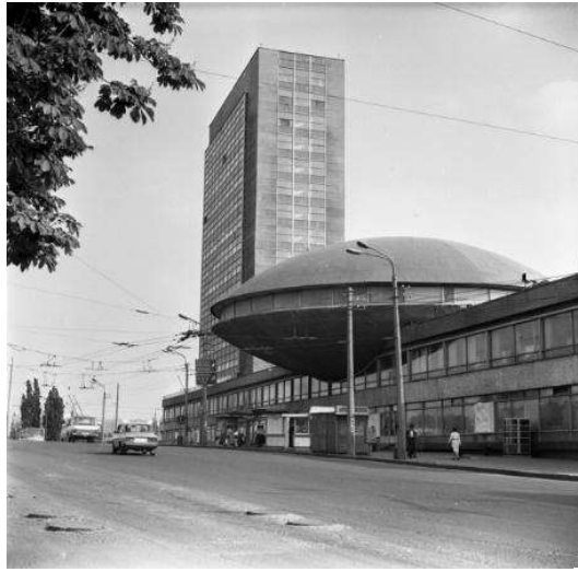
Рис.7. Інституту науково-технічної і економічної інформації. Арх. Ф. Юр'єв 1971 р.

архітектурі Заходу тоді нічого не знав. Пізніше дізнався, що в Оскара Німейєра був схожий купол (рис. 8), але це було вже через п'ять чи десять років [3].