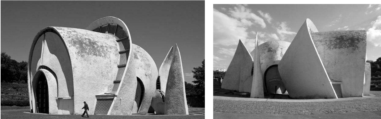
Рис.4. Київській крематорій. Зали прощання. Арх. А. Мілецький. 1975 р.

Серед київських архітекторів цей напрямок успішно використовував у своїй творчості А. Мілецький. Найяскравіше риси біоніки виявились в будівлі київського крематорію, побудованого за проектом автора в 1975 році (рис. 4).