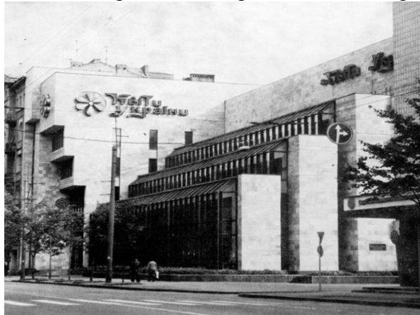
Рис.11. Учбово-методичний павільйон «Квіти України» по вул. Січових Стрільців. Арх.: М. Левчук, Є. Гончаренко, Б. Лавров, інж. М. Паніч. 1985 р.

Аналіз світової архітектурної спадщини свідчить, що система взаємних впливів творчих напрямків є невід'ємною складовою загального культурного розвитку. Однак тут не мається на увазі відверте копіювання. Без творчого переосмислення новітніх мистецьких течій результатом роботи архітектора може стати кіч ( Kitsch ), як результат механічного копіювання загальновідомих шаблонів, проте більшість знакових громадських будівель Києва 1960 – 1980-х років є самостійними високохудожніми творами. Врешті, радянська партійно-політична система не могла цього допустити. Архітектура капіталістичних країн трактувалась як система відображення деградованого, повного соціальних антагонізмів суспільства, яке знаходиться на останньому етапі свого існування. Проте усвідомлюючи високий рівень розвитку архітектурно-будівельної галузі зарубіжних країн, їхній досвід активно вивчався.