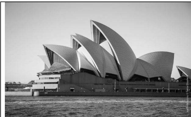
Рис.5. Сіднейський оперний театр. Арх. Йорна Утзона. 1973 р.

За свою оригінальністю форм цей об'єкт можна розглядати спільно з всесвітньо відомими Сіднейським оперним театром архітектора Йорна Утзона (рис. 5), Храму Лотоса у місті Нью-Делі в Індії арх. Фаріборз Сахба (рис. 6), та інших.