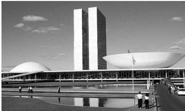
Рис.8. Палац Національного конгресу в Бразилії. Арх. О. Німейєр https://uk.wikipedia.org/w/index.php?title=%D0%A4%D0%B0%D1%80%D1%96%D0%B1%D0%BE%D1%80%D0%B7_%D0%A1%D0%B0%D1%85%D0%B1%D0%B0&action=edit&redlink=1 . 1960 р.

Стосовно походження незвичної форми, архітектор говорить так: «Об'єм народжувався з функції. Уявіть собі зал: і в нього повинен бути амфітеатр, і в нього повинен бути купол. Це акустичний об'єм, його залишалось тільки оформити конструктивно» [4].