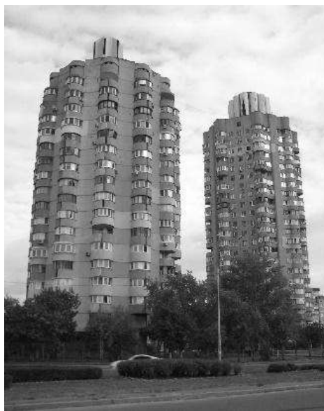
Рис.3. Експериментальний комплекс житлових будинків з універсамом на Оболоні.

Модернізм як стиль в різних країнах мав певні особливості розвитку, проте основні тенденції були спільними. Популярні стильові течії мали взаємний вплив на творчість архітекторів. Тому в знакових громадських будівлях Києва 1960 – 1980-х років можна відслідкувати безліч спільних із західною архітектурою рис.