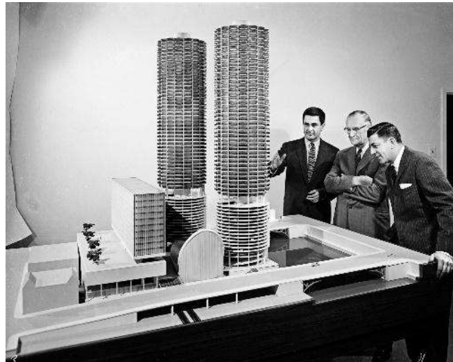
Рис.2. Багатофункціональний комплекс Марина Сіті. Фото з макету.