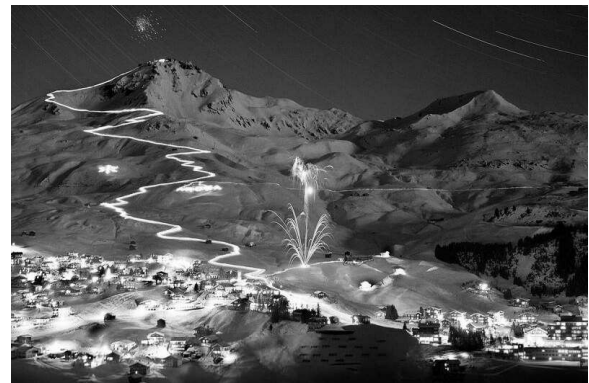
Рис. 3. Гірськолижний курорт Гріндевальд (Grindelwald) в Швейцарії