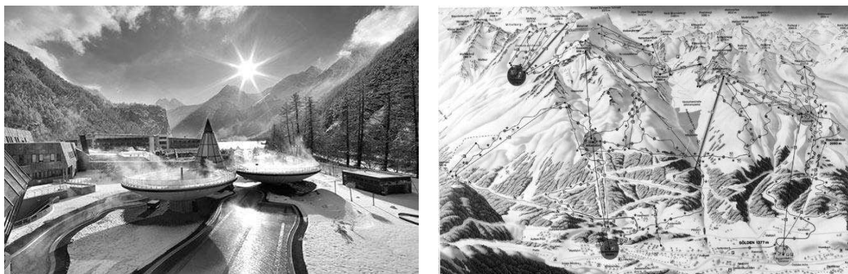
Рис. 4. Гірськолижний комплекс Зельден (Soelden) в Австрії