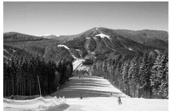
Рис. 2. Гірськолижний курорт Буковель в Україні