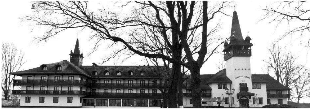
Рис.3. Загальний вигляд готелю «Іванчо Бірток»