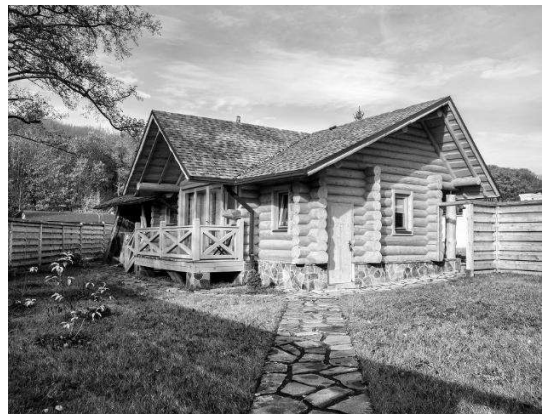
Рис.2. Ознаки «садибного» стилю на прикладі санаторно-оздоровчого комплексу «Деренівська купіль»

Будівництво оздоровчо-рекреаційного комплексу «Термальні води «Косино» проводилось з 2012 року по 2016 року с. Косонь, Береговського району, Закарпатської області на місці старої бази відпочинку (рис.3).