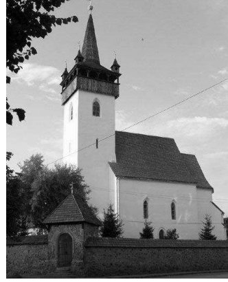
Рис.5. Вхідна група готелю «Іванчо Бірток»(ліворуч), що імітує вежу готичного стилю оборонного типу , праворуч - Реформаторська церква, м. Хуст, XIII ст.