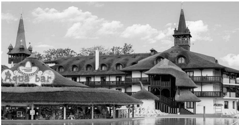
Рис.1. Архітектурні елементи модерну у «швейцарському» стилі. Оздоровчо-рекреаційний комплекс «Термальні води «Косино»

Прототипом таких будівель слугував будинок-шале.