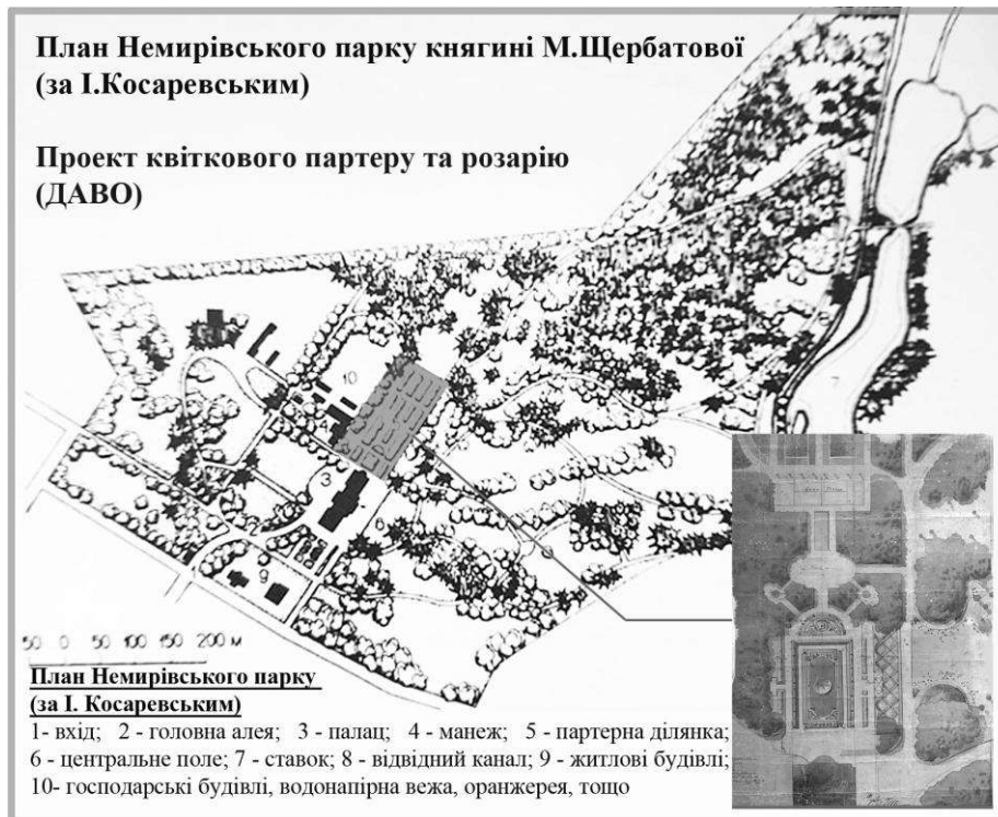
Рис. 2. План Немирівського парку княгині М.Щербатової [6], [20]

У різні роки над художньо-естетичним образом парку працювали садівники Брюссель Е. Пінаерт ван Геєрт, Ф.Томайєр та В.Пехар [2]. На території немирівського парку збереглися класицистичний палац, деякі господарські споруди, алеї, квітники, окремі статуї, а також ставки. Збережена ділянка садово-паркового ландшафту регулярного стилю. На території парку було побудовано кілька сучасних корпусів санаторію «Авангард», який функціонує там і сьогодні. У пейзажній частині парку створений сосновий та листяний лісові масиви. З 250 видів історично посаджений видів дерев і кущів, на сьогоднішній день збережено близько 120 [2].