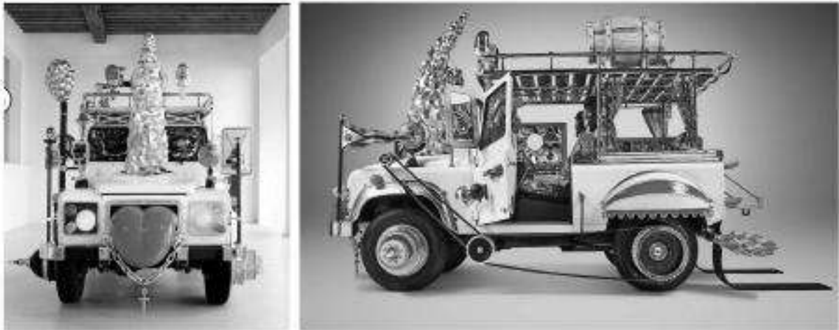
Специальная версия Land Rover к 65 летию основания (300x520x290см), 2013 год