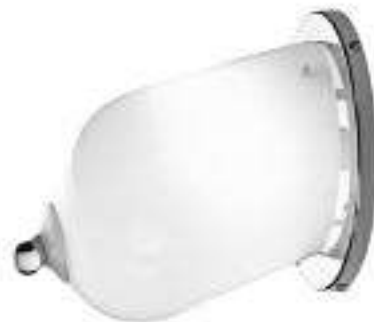
Tit Lamp для Venini (30x26x26 см), муранское стекло, 2010 год