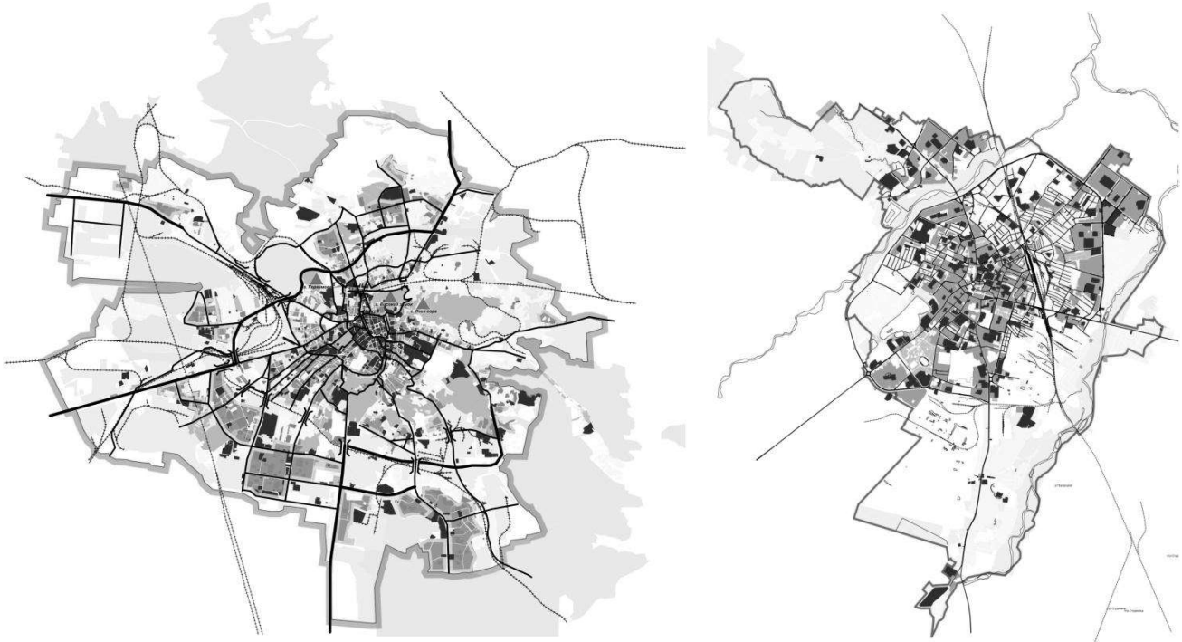
Рис. 2. Просторова структура м. Івано-Франківська

Історична унікальність просторів вибраних міст проявляється в унікальності історії кожного з них. Як найдосконалішу діяльність щодо збереження й використання об'єктів історичної спадщини вибраних міст та діяльність з їх охорони й використання (будівництва в історичному середовищі), на думку експертів, слід визнати м. Чернівці. Незважаючи на включення значної частини історичної забудови Львова до Списку ЮНЕСКО, реальне відношення до історичної спадщини та діяльність з її збереження й використання слід вважати, на думку експертів, найгіршою серед вибраних для аналізу міст.