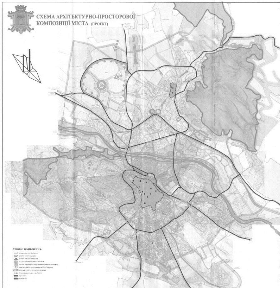
Рис. 2. Схема архітектурно-просторової композиції міста Чернівці (проект) (Графічний матеріал містобудівної документації м. Чернівці)

Висотність та тип забудови регулюються генпланом міста (рис. 3), а масштаб та архітектурне вирішення на наступних стадіях проектування. Однак при конкретному проектуванні тих чи інших об'єктів в даній зоні в проектній документації повинні бути присутні матеріали, які б відображали, як вписується нова забудова в панораму міста. Особливо це стосується тих кварталів які потрапляють в зону регулювання забудови.