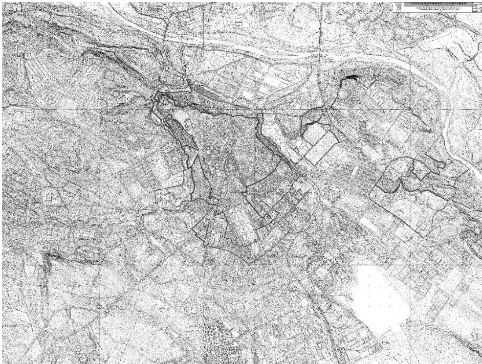
Рис.4. Проект коригування історико-архітектурного опорного плану і зон охорони та режимів використання історичних ареалів м. Чернівці. (Виконаний у 2006р. київським інститутом “УКРНДПРОКТРЕСТАВРАЦІЯ”)[4].

В той же час територія ядра загальноміського центру потребує проведення комплексу заходів по підвищенню ефективності її функціонального використання в зв'язку з тим, що значна кількість існуючих об'єктів відноситься до сфери стандартного обслуговування і не відповідає необхідному рівню послуг та є причиною навантаження, яке створює в історичному ядрі центру постійне та тимчасове населення міста, зони впливу, а також значна кількість туристів. При цьому, в зв'язку із значною цінністю історико-архітектурної спадщини, капітальністю та щільністю забудови, майже повною відсутністю територіальних резервів, великими транспортними та пішохідними потоками значні функціонально-територіальні перетворення на території ядра неможливі та недоцільні. Створення підцентрів дає можливість територіально розширити зону активного впливу загальноміського центру і наблизити його до периферійних районів, а також компенсувати функціональну недовантаженість ядра центру шляхом розміщення в підцентрах крупних об'єктів обслуговування, які притягають до себе значні потоки людей. Одночасно з цим розвиток підцентрів забезпечить розвантаження історичного ядра міста від надмірних потоків людей та машинопотоків, переорієнтувавши їх на себе.