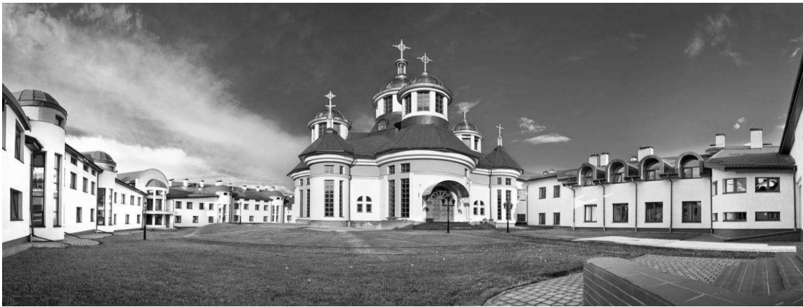
Рис. 4. Храм Львівської Духовної Семінарії

діяльності їй було передбачено. Для цього автори проекту виокремили із усіх споруд та приміщень духовної семінарії окремі функціональні блоки споруд або приміщень: 1) храм; 2) адміністративно-навчальний блок; 3) житловий блок для студентів і настоятелів; 4) спортивний блок; 5) блок їдальні. Храм духовної семінарії, в якій навчається 180 студентів, було запроєктовано на 200 місць. Керівництвом семінарії було прийняте рішення спорудити храм закритого типу на території внутрішнього подвір'я із східною орієнтацією вівтарної частини (Рис.4)