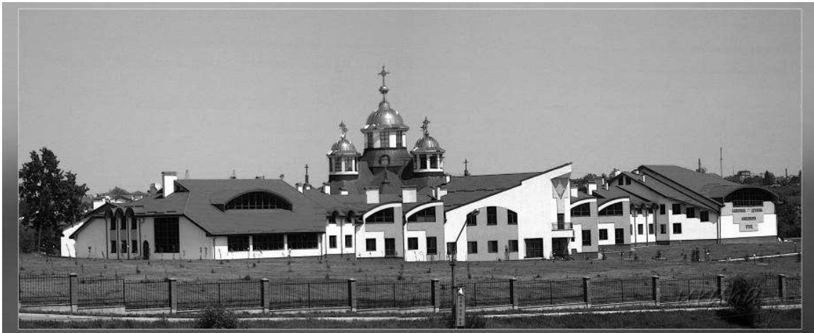
Рис. 1. Комплекс Львівська Духовна Семінарія св. Духа на вул. Хуторівка

Створення єдиного духовно-освітнього комплексу на базі духовної семінарії передбачало можливість розташування будівель семінарії, університету та студентатів в межах однієї території. Проте, специфіка духовної і освітньої діяльності кожного освітнього підрозділу вимагала індивідуального підходу в облаштуванні території довкола кожного такого закладу. Разом з тим загальна територія є одним з найбільш вагомих об'єднуючих факторів, що формують архітектурне обличчя усього духовно-освітнього комплексу. Тому архітекторам було важливо визначити які з елементів облаштування території комплексу є індивідуальними для кожного закладу, а які є загальними. Беручи до уваги містобудівельний аспект, а саме місцезнаходження головної вулиці, було спроектовано генплан території таким чином, щоб духовні освітні заклади відкритого типу (богословський університет, пасторально-місійний центр та, частково, духовна семінарія) знаходилися ближче до головної вулиці, а заклади типу монастирів були більш віддалені та ізольовані.