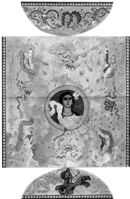
1. Склепіння й люнети склепу Деметри (за М. І. Ростовцевим), початок ХХ ст.

Стіна над входом прикрашена більшим аканфовим пагінцем, дві гілки якого з'єднуються у центрі гірлянди. Кожне стебло прикрашене фруктами: на одному можна розпізнати гранати (як поховальний символ), на іншому — букет