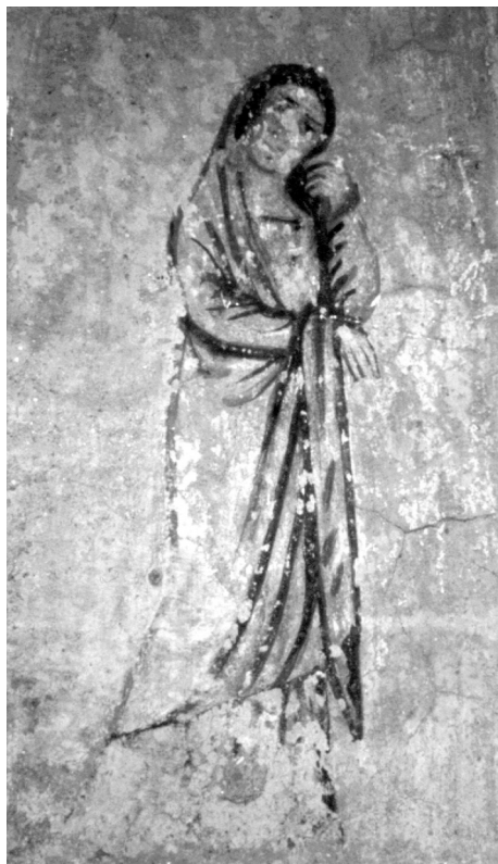
4. Зображення німфи Каліпсо (сучасний стан)