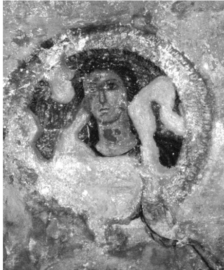
2. Зображення Деметри (сучасний стан)

Протягом усього ХХ ст. науковці раз у раз відзначали погіршення стану живопису склепу, особливо це характерно для другої половини минулого століття. Стан пам'ятки у 1990-х рр. був вже катастрофічним, ґрунтові води затоп-