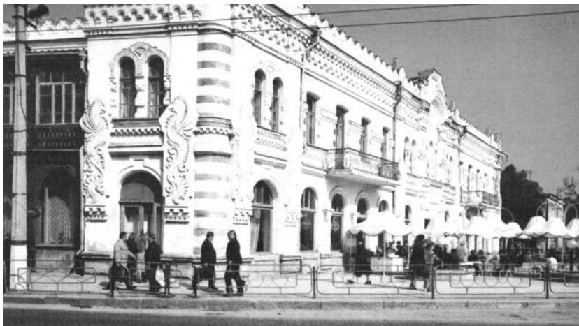
1. Центральная часть Симферополя

мер, многочисленные памятники В. И. Ленину), в некоторых случаях — аварийное состояние объекта [7].