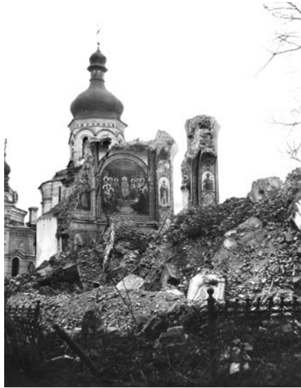
Руїни Успенського собору

Ф. И. Титов. Значение КПЛ для русского народа