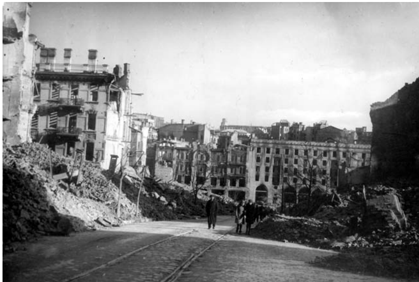
Вулиця Прорізна за воєнного часу: вигляд у бік Хрещатика