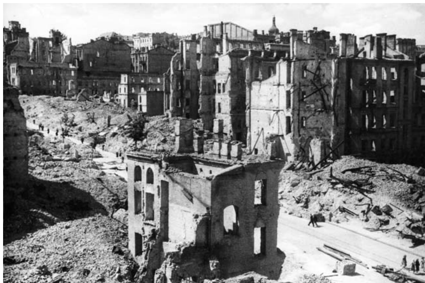
Вулиця Прорізна за воєнного часу: вигляд з Хрещатика