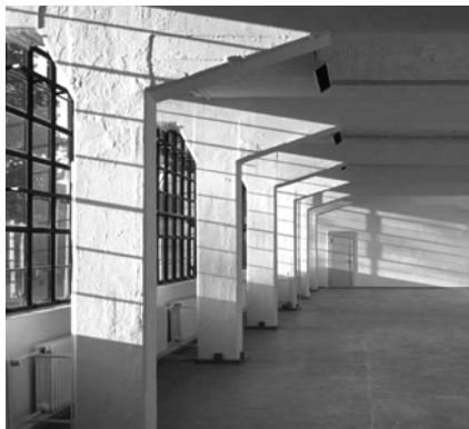
Баухауз. З'єднувальний перехід (міст); інтер'єр майстерні

ка демонструє різні аспекти і методи роботи з оновлення споруди: історія використання будівлі Баухаузу, робочі методи експертів в дослідженні і реставрації поверхонь будинку та історичний підхід проливають світло на різні аспекти процесу відновлення і сприяють глибокому наповненню будівлі. Поки тривала виставка, будівля безпосередньо стала експонатом: тимчасові художні інтервенції були реалізовані в архітектурних ключових елементах просторової організації споруди — таких, як сходи, аудиторія та їдальня — і слугували заохоченню усвідомлення архітектурної історії будівлі. Будівля Баухаузу є прикладом структурних принципів сучасної просторової організації, це є архітектурна форма, що охопила організацію процесів щоденного життя. Щоб відзначити кінець оновлення та 80-у річницю спорудження, 2006 р. у видавництві «Jovis» у Берліні Фонд здійснив серію книжкових видань: «Археологія Модернізму — відновлення Баухаузу Дессау», «Ікона Модернізму — Будівля Баухаузу в Дессау» (книга, що супроводжує виставку) та навесні 2007 р. випустив книжку «Баухауз Дессау — архітектура, дизайн, ідея».