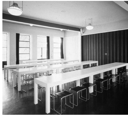
Баухауз. Сходи. Інтер'єр їдальні

архітектори з різних країн і створили явище світового масштабу — в першій половині ХХ століття в Баухаузі працювали росіянин Василь Кандинський, швейцарці Пауль Клее та Йоханнес Іттен, угорець Ласло Моголі-Надь, німці Вальтер Гропіус та Оскар Шлеммер, американець Людвіг Міс Ван дер Роє та інші.