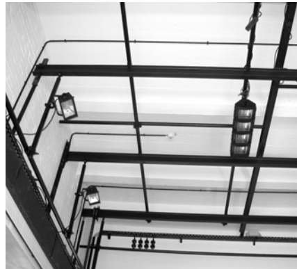
Баухауз. Театр — поліфункціональна зала; деталь конструкції освітлення

нішнім і внутрішнім простором. Оскільки територія, що оточує будівлю, складає важливий компонент архітектурної концепції, вона теж внесена до Переліку світової спадщини ЮНЕСКО. Проект організації зовнішньої території є результатом конкурсу, оголошеного містом Дессау 2004 р., метою якого є перепланування зони між залізничним вокзалом, університетським містечком Університету Прикладних Наук Саксонії та площею Баухаузу. Метою проектування зовнішнього благоустрою, яке почалося 2006 р., поза функціональним удосконаленням необхідних процесів, таких як під'їзд (стоянка) та доставка вантажу — ще й широка перспектива, аби розкрити художню та історичну цінність Баухаузу. Замовлений проект відкритої території включає кілька елементів: історичний профіль з тротуаром, бордюром та проїжджою частиною, що свого часу об'єднала різні види бруківки, має бути замінена смугою асфальту; це визначить напрям вулиці від площі Баухаузу до залізничного вокзалу; дерева та навколишні газони зовнішнього благоустрою Баухаузу. Роботи будуть завершені 2007 р.