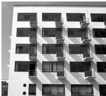
Баухауз. Фрагменти корпусу гуртожитку

призвести до втрати значення самої пам'ятки. Точне знання будівельного матеріалу, його складу, яким чином він старіє, і як статика та фізичні параметри споруди взаємодіють з різними будівельними матеріалами, є вирішальними факторами у подальших планах підтримки старих будівель.