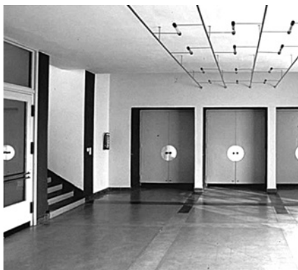
Баухауз. Об'єднаний простір їдальні та поліфункціональної зали, фойє перед входом до театру

Практика «Археології Модернізму» [5] — оновлення і дослідження сподури спричинило детальне і частково нове дивовижне наповнення будівлі і подарувала знахідки, що мають також важливе значення для підходу до модерністських будівель взагалі.