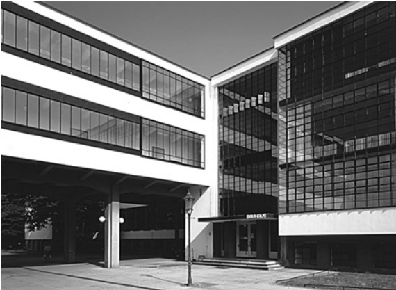
Головний вхід Баухаузу

тягом Другого Семінару Вальтера Гропіуса розробляється ключова ідея «Ареалу Індустріального парку» важлива для розвитку Землі Верхньої Саксонії. 1994 р. Баухауз Дессау перетворений на Громадський Фонд з трьома відділеннями: Майстернею, Колекцією та Академією. Завданням Фонду є збереження, передача та вивчення спадку істо-