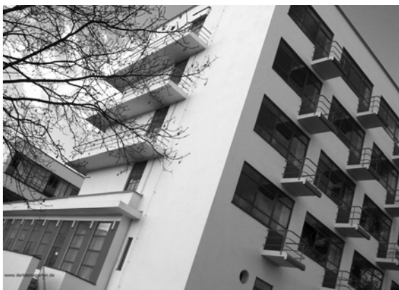
Баухауз. Фрагмент корпусу гуртожитку

льних конструкцій, датованих 1926 р., була збережена, зроблено акцент на реставрації і реконструкції. Тут ремонти і заміни здійснювалися, де можливо копіями, які виготовлялися, щоб зберегти і показати естетичну й історичну цінність пам'ятки [4]. В інших частинах — фокус на консервації і ремонті.