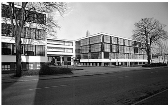
Зовнішній фасад Баухаузу

ші установи. Архітектурні плани розвитку території між залізничною станцією та будівлею Баухаузу, розроблені Карлом Фігером, знехтувані, 1936–1937 рр. навколо Баухаузу будується житло. 7 березня 1945 р. частина споруди згоріла після потужного повітряного нальоту на Дессау. 1946 р. намагання оживити Баухауз в Дессау у якості Вищої архітектурної школи терплять поразку через політичну опозицію 1947 р. У 1946–1948 рр. фасад крила майстерні латається тимчасово спорудженою цегляною стіною з дерев'яною рамою з вікнами від барака, яка