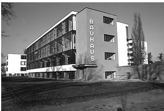
Вигляд Баухаузу з вулиці

спілок в Бернау біля Берліна. Карл Фігер, інженер Фрідріх Кун, Ганс Вітвер, Людвіг Гільберзімер, Антон Бреннер, Алкар Рудельт та Март Штам викладали на архітектурному відділенні. Не дивлячись на успіхи Баухаузу, марксистські погляди Ганса Меєра стали проблемою для муніципальної ради в часи політичної не-