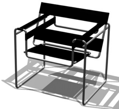
Баухауз. Крісло, автор Марсель Брейер

Resume. The information given in an article on an occasion of the 80th anniversary of the Baubaus Building in Dessau is aimed to analyze and to use the restoration approaches for preservation of cultural legacy of modernism. Key words. Baubaus, UNESCO World Cultural Heritage, Manifest of Baubaus ideas, Icon of Modernism, Gesamtkunstwerk, Archaeology of Modernism.