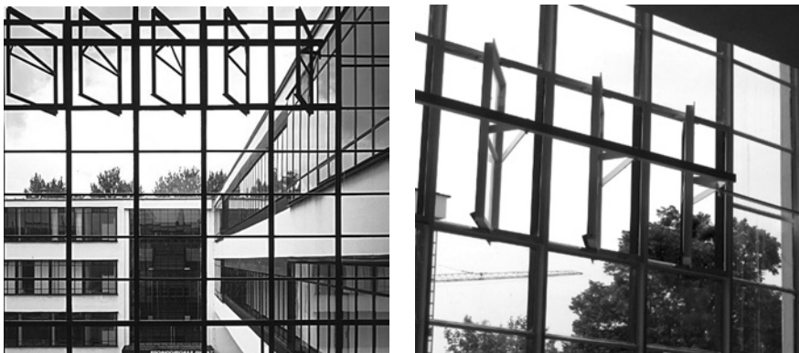
Баухауз. Конструкція вікна; деталь конструкції вікна

— Венеція, 1964. — Мета. Стаття 3. «Консервація і реставрація пам'яток мають на меті збереження пам'яток як витворів мистецтва і як свідків історії».