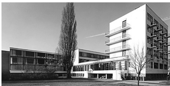
Внутрішній фасад Баухаузу

через декаду, 1960–1961 рр., була розібрана. 1963 р. розробляються плани реконструкції будівлі Баухаузу, а 1964 р. Баухауз включений до Списку Пам'яток Району Галле. 1965 р. оновлюється фасад крила майстерні та вікна на сходах; реконструюються окремі кімнати. 1974 р. будівля Баухаузу додана до Реєстру Видатних Пам'яток НДР, і 1976 р. реставрація відбувається згідно з суворим дотриманням норм щодо заходів збереження історичних будівель та пам'яток. Далі низка офіційних святкувань наступних роковин відкриття Баухаузу в Дессау дуже нагадує радянську дійсність, але, на щастя, з цілком протилежним результатом. 4-го грудня 1976 р. офіційне урочисте повторне відкриття Баухаузу у 50-у річницю відкриття Баухаузу в Дессау. З 1977 р. кілька кімнат відведені для Академічного Культурного Центру, згодом засновується Колекція історії Баухаузу. Проводяться виставки та культурні події у приміщенні театру Баухаузу. 1-го квітня 1984 р. у Баухаузі розпочинає свою діяльність Освітній центр. 4-го грудня 1986 р. — повторне відкриття в Баухаузі Центру Дизайну, офіційне державне святкування 60-х роковин відкриття Баухаузу в Дессау. 1989 р. про-