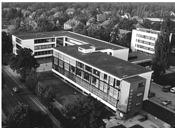
Вид Баухаузу з тишиного льоту