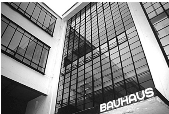
Баухауз. Деталь головного входу

Як тільки реабілітаційні завдання були викладені й узгоджені з усіма відповідальними особами, цей план став слугувати направляючою для всіх рішень, що мали бути прийняті протягом процесу відновлення. Є два аспекти цього загального плану, на які я маю звернути увагу тут: встановлення пріоритетів планування і виконання будівельних заходів; та турбота щодо збереження оригінальної тканини споруди. Обидва аспекти можуть бути знайдені у Венеційській Хартії, прийнятій на II Міжнародному конгресі архітекторів і технічних фахівців з історичних пам'яток у Венеції 1964 р., яка забезпечує початковий пункт для реабілітації історичних будівель в країнах по всьому світу.