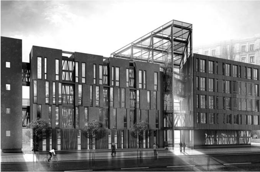
1. Ескіз-ідея сучасної бібліотеки ім. Є. П. Кушнарьова у Харкові. Перша премія

мом й частину вулиці Сумської. Ділянка під забудову — в зоні саду ім. Т. Г. Шевченка, пам'ятки ландшафтної архітектури та садово-паркового мистецтва.