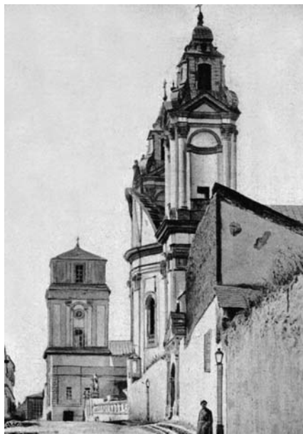
3. Кармелітський костьол у забудові бул. Татарської. Вигляд з півночі. Світлина не пізніше початку 1870-х

приписують ще трьом костьолам на Поділлі — бернардинському костьолу в Іванові на Вінниччині, та костьолам домініканців-обсервантів у Сидорові та Босих кармелітів у Купині [17].