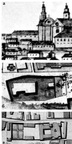
1. а) Кармелітський кляштор в панорамі Кам'янця-Подільського початку XIX ст.; б) кляштор на плані Кам'янця 1746–1749 рр.; в) кляштор на плані Кам'янця 1773 р.

У післятурецькому Кам'янці-Подільському серед офіцерів новозаснова-