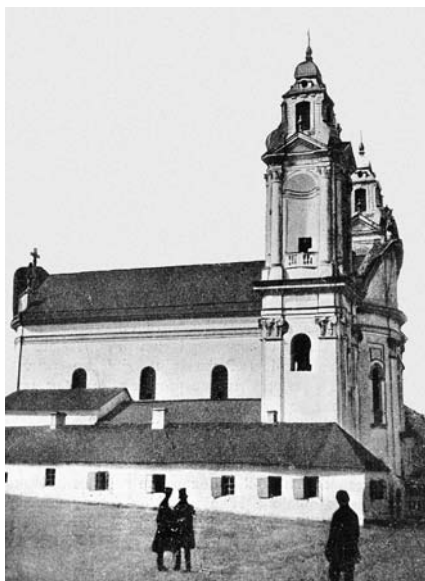
2. Костьол Діви Марії та св. Йосифа кляштору Босих кар- мелітів. Вигляд з півдня у забудові вул. Татарської. Фото Ю. Кордиша, 1865

ного Корпусу артилерії коронної в середині XVIII ст. з'явилася постать, яка здобула славу архітектора європейського рівня завдяки визнаному шедевр барокової архітектури — домініканському костьолу Божого Тіла у Львові. Автором львівського костьолу був Ян де Вітте, капітан артилерії коронної, кам'ячанин, який 1734 р. заступив Анджея Ґловера на посаді «суперінтенданта ремонту фортеці» і завершив військову кар'єру генерал-лейтенантом (з 1781 р.) і кавалером ордену св. Станіслава [15]. Сучасники писали про Яна де Вітте, як про «знаменитого на цілу Польщу архітектора», який 1744 р. у неправдоподібно короткий термін — 4 місяці — виконав проект львівського костьолу. З. Горнунг вважав, що «не було в той час на тому терені (на Поділлі. — О. П.) архітектора, який би міг змагатися з ним здібностями й освітою» [16]. Ян де Вітте (1709–1785) здобув військову освіту у Кам'янці під началом комендантів фортеці генерал-майорів Вільгельма Раппе (1710–1716 рр.), Вацлава Жевуського (1734–1737 рр.), Яна-Йоахіма Компенгаузена (1737–1739 рр.) та Крістіана Дальке (перебував у Кам'янці з 1737 р., комендант у 1750–1763 рр.), які мали високу архітектурну й технічну кваліфікацію. Він прожив у Кам'янці усе життя, перебував на посаді коменданта фортеці найдовше (1767–1785 рр.) і став найвідомішим з комендантів, одночасно увійшовши в історію архітектури як автор кількох визначних костьолів. Окрім львівського домініканського костьолу та костьолу Босих кармелітів у Бердичеві авторство Яна де Вітте дослідники