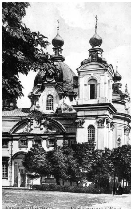
6. Собор ікони Казанської Божої Матері. Вид з південного сходу. Фото кінця XIX ст.

святих пророків Іллі та Єлисея (див. рис. 3 ), які після переосвячення костюлу на православний собор були перенесені на міський цвинтар [27]. Західний фасад, дугоподібно виступаючий аналогічно головному східному і розчленований на три поля пілястрами тосканського ордеру, також увінчував овальний фронтон, прикрашений рельєфом з круглим вікном у тимпані; над фронтонном вивіщувався масивний білокам'яний хрест, а по боках стояли різьблені з білого каменя вази (див. рис. 7 ). До північного фасаду костюлу примикали П-подібні у плані двоповерхові корпуси келій під високими гонтовими дахами (див. рис. 16, 18, 46 ), що відрізнялися стриманим архітектурним вирішенням.