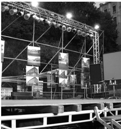
«Ortszeit Local Time (Місцевий час)» Штефан Конпелькам