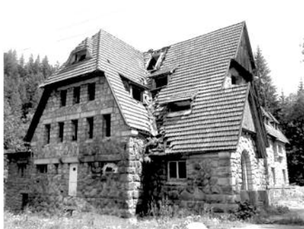
1. Колишня відпочинкова вілла «Страшний двір» у смт Татарів Івано-Франківської області. Головний фасад. Поштівка початку ХХ ст., фотофіксація 2010 року

тури; з реставрації, консервації, ремонту цінної історичної забудови; проведення робіт з ліквідації аварійного стану нововиявлених пам'яток архітектури.