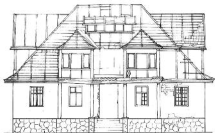
2. Дерев'яний корпус колишнього пансіонату «Рай» розташований по вул. Курортній в м. Яремче Івано-Франківської області. Фотофіксація 2011 р. Кресленик головного фасаду споруди виконав студент ІФНТУНГ А. Дейчаківський

на другому — Яремчанська дитяча школа мистецтв; колишня відпочинкова вілла «Надія» по вул. Свободи, 315, сьогодні це один з корпусів дитячого санаторію «Прикарпатський», та інші.