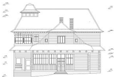
4. Кошия відпочинкова вілла «Марія» по вул. Данила Галицького, 2 у смт Ворохта Івано-Франківської області. Фотофіксація головного фасаду споруди 2012 р. Кресленник бічного фасаду споруди виконала студентка ІФНТУНГ Н. Скрипничук

тації для складання паспортів нововиявлених пам'яток архітектури, оскільки на території Івано-Франківської області діє держбюджетна програма «Паспортизація, інвентаризація та реставрація пам'яток архітектури» на 2013–2015 рр. У рамках цієї програми передбачено: