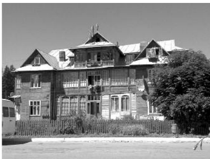
5. Колишня відпочинкова вілла «Лена» по вул. Данила Галицького, 46 у смт Ворохта Івано-Франківської області. Поштівка початку ХХ ст. Фотофіксація головного фасаду споруди 2012 р.

– готелі, мотелі, кемпінги та інші засоби тимчасового розміщення (проживання).