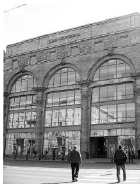
17. Твори архіт. М. Лялевича. Зліва направо: Земельний банк (нині Будинок офіцерів) в Луцьку, фото 1930-х; будинок Мертенса в Петербурзі, 1911 р.

Ключевые слова: история архитектуры Вольни, период между войнами, римско-католические костелы, модернизм, конструктивизм.