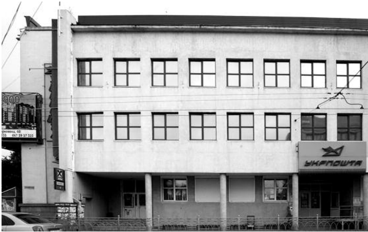
16. Поштамт в Рівному. Архіт. Юліан Нейман. Фото автора

15. Barucki T. Architektura II Rzeczypospolitej na jej wschodnich ziemiach // SARP. — 2006. — № 3. — S. 54.