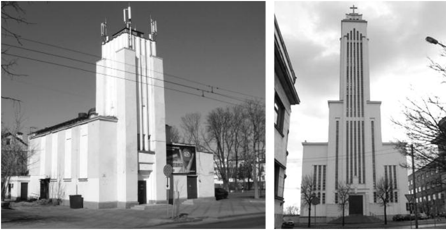
13. Зліва направо — гарнізонний костюл св. Антонія Падуанського в Бресті, архіт. Ю. Бараньський; костюл Воскресіння Господнього у Вільнюсі, архіт. Кароліс Рейсонас, 1938

До найбільш цікавих можна віднести поштамт (1931, Julian Neyman, рис. 16 ) та гімназію в Рівному (Miechowicz), судові будинки в Ковелю та Кременці, банк, поштамт (нині міська рада), Земельне управління (нині Волинський краєзнавчий музей) та Земельний банк (нині Будинок офіцерів) в Луцьку, запроєктований одним з найвідоміших архітекторів Петербургу — Маріаном Лялевичем, майстром модерну і ар-деко [17; 18, с. 915] ( рис. 17 ).