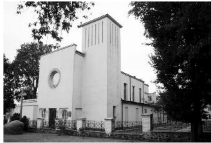
6. Костьол в с. Лецятів Львівської обл.