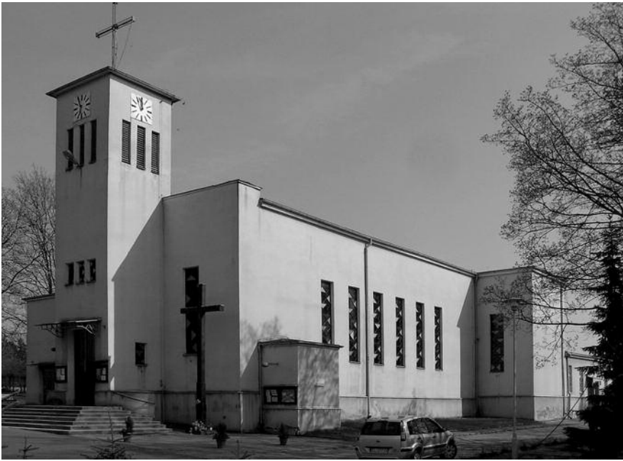
14. Лодзь. Костьол св. Єльжбети. Архіт. Веслав Лісовські. 1932 р.

На жаль, кращі зразки архітектури цього періоду можуть бути остаточно втрачені. Не маючи охоронного статусу, архітектура цього періоду активно перебудовується до непізнаності або зноситься. Це стосується не тільки Волині, але й інших регіонів України — Києва, Харкова, Донецька. Необхідно звернути увагу державних установ України і міжнародної громадськості на цілісне явище, яке заслуговує на докладні дослідження і дбайливе збереження — архітектуру 1920–1940-х.