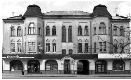
2. Будинки, запроектовані С. Тимошенком: а — станція Албаши в станиці Новоминській Канівського р-ну Краснодарського краю. 1910 р.; б — будинок по вул. Плехановській, 29 у Харкові. 1914 р.

вий центр Луцька [1, с. 88]. Відомо, що реалізацію генерального плану унеможливили війна і чергова зміна державності.