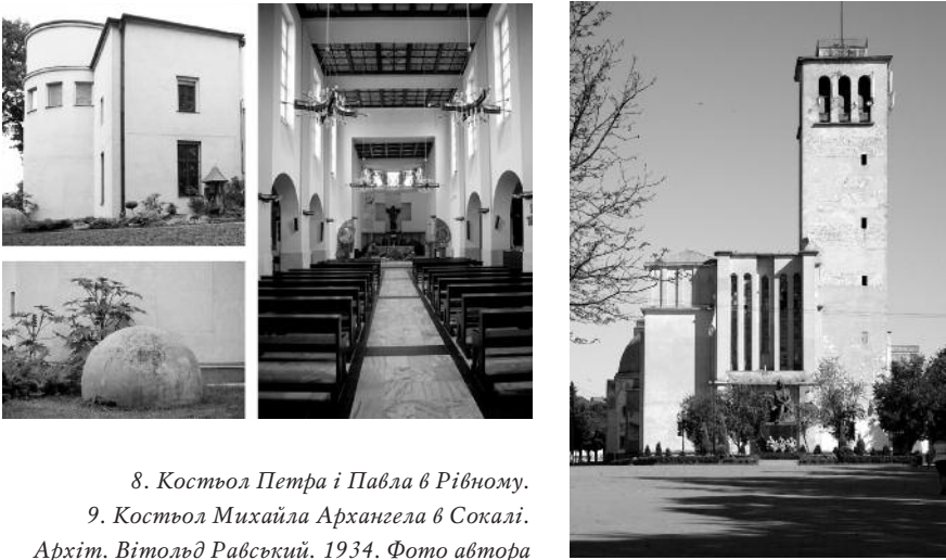
8. Костьол Петра і Павла в Рівному.