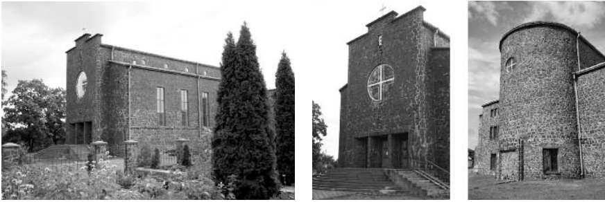
4. Костьол в Сарнах. Архіт. Владислав Стахонь.