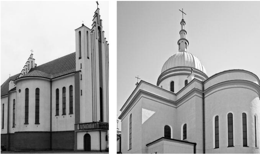
12. Роботи Архіт. Вітольда Равського в Польщі: Костьоли у Дембовиці, 1936 р., та Короля Христа в Жешуві, 1931–1937 рр.

Г. Ревзін, аналізуючи будівлі архітекторів Ді Фаусто в Джеддаїмі (Лівія) і на Родосі, Мураторе в Кортогіане (Сардинія), Петруччі в Сегеції, Петракко в Портолаго на Леросі (Греція), звертає увагу, що вони дуже нагадують роботи братів Весніних, Голосова, Гінзбурга кінця 1920-х — початку 1930-х (рис. 15). «Нашим авангардистам в этом смысле повезло — Сталин эту архитектуру запретил, и она приобрела статус жертвенности, а Муссолини поддержал, и она стала выражением фашизма. Иллюстрация того, насколько случайно любое соединение архитектуры с политикой и насколько это несправедливая случайность» [16].