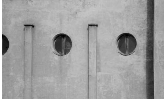
10. Костьол Михайла Архангела в Сокалі. Архіт. В. Равський. 1934. 11. Костьол Михайла Архангела в Сокалі. Деталь.

ний костьол і досі відіграє значну містобудівну роль в формуванні нового центру Рівного [14, с. 84].